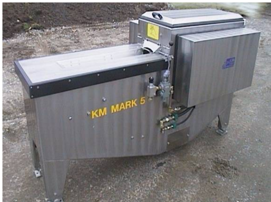
Bilde 5 Sløyemaskin (ill. foto)

Heller ikke på denne båten ble det brukt sjøvann i mottaksbingene. Dersom fangsten kunne slippes ned i en mottakstank fylt med sjøvann ville en del fisk fortsette å leve frem til den ble tatt ut til bløgging. I dag er det imidlertid vanlig å vente med å åpne mottaksbingene inn til fisken har "roet seg" (begynner å dø), og dermed blir lettere å håndtere under direktesløyning.