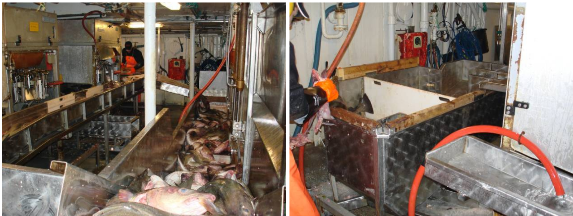
Bilde 3 Fra utblødning til sløyemaskin (venstre) eller manuell sløyning

Fisk som transporteres fra blødebingene til sløyemaskinene kan risikere å gå flere "runder". Det gir stor belastning på fisken da den får tøff behandling i transportbåndene, med mange fall. Her bør man lage en bedre løsning, som gir mer skånsom behandling.