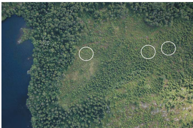
Flybilde over testområdet vårt i Østmarka ved Oslo. Vi ser vann, gammel skog og tilplantet snauflete. Tre av prøveflatene i ungskog er markert.

Barmasse er sterkt knyttet til kronetetthet og til bladarealindeks (LAI), og er viktig for fjernmåling av skogens helsetilstand. Vi kan nå presentere foreløpige, men lovende resultater for måling av barmasse ved hjelp av flybåren laserskanning.