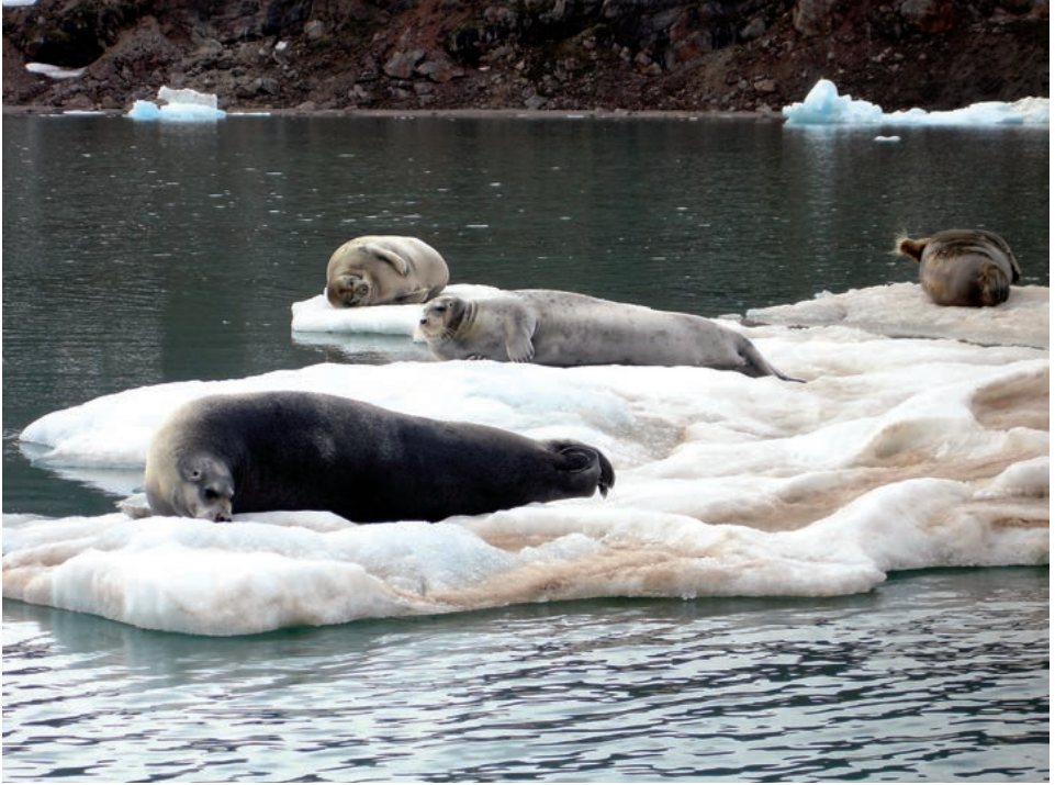
Hold avstand til storkobber på isflak. Bildet er tatt med telelinse.