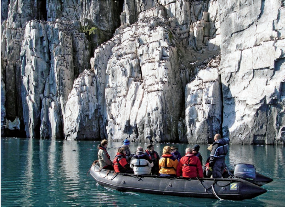
På sjøen under fuglefjell må det holdes avstand av hensyn til fuglene, men også på grunn av faren for stein og is som kan løsne.