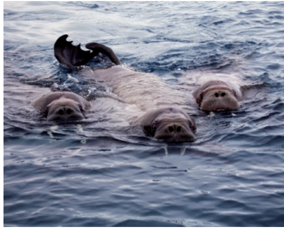
Hvalrosser i sjøen kan se ufarlige og trege ut, men de er uberegnelige og kan utgjøre en fare med støttene og kroppen, spesielt når du ferdes i kajakk eller gummibåt.