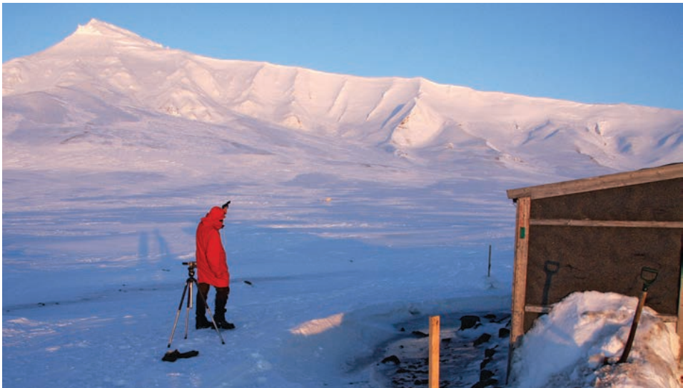
Nysgjerrige isbjørner må skremmes på god avstand dersom de kommer inn til hytter, teltleir eller lignende. Her skremmes ei binne med unger på over 100 meters hold. Knallskuddet ble plassert foran binna. Det må ikke skytes i lufta!

Ved ankomst til ei hytte eller en leir bør man ta en vid runde rundt med skuter/tilfots før en inntar hytta/leiren.