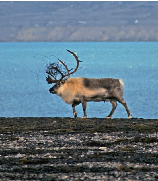
Forsøpling fra mennesker kan skade dyrelivet på Svalbard. Her har en svalbardrein fått ståltråd viklet inn i geviret.

Studier har vist at større dyr flykter lengre enn småvokste arter ved forstyrrelser. Dyr i flokk reagerer på større avstander. Hunndyr med unger er ofte de mest sårbare for ferdsel. Reaksjonsmønsteret til dyr som blir forstyrret kan være tilvenning, tiltrekning eller at de trekker unna.