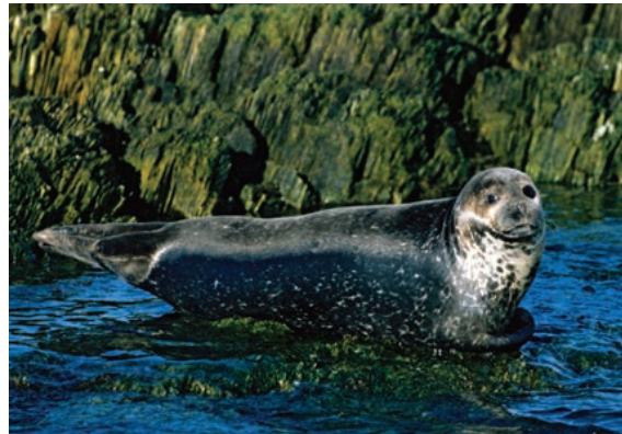
Steinkobber legger seg normalt på tørrelagte skjær. Her fødes også ungen.

Steinkobben har et avgrenset leveområde rundt Prins Karls Forland og regnes derfor som en kuriositet på Svalbard. De er sosiale dyr som opptrer i grupper. Steinkobben føder sin ene unge i fjæresonen. Den hviler på land (ikke på is).