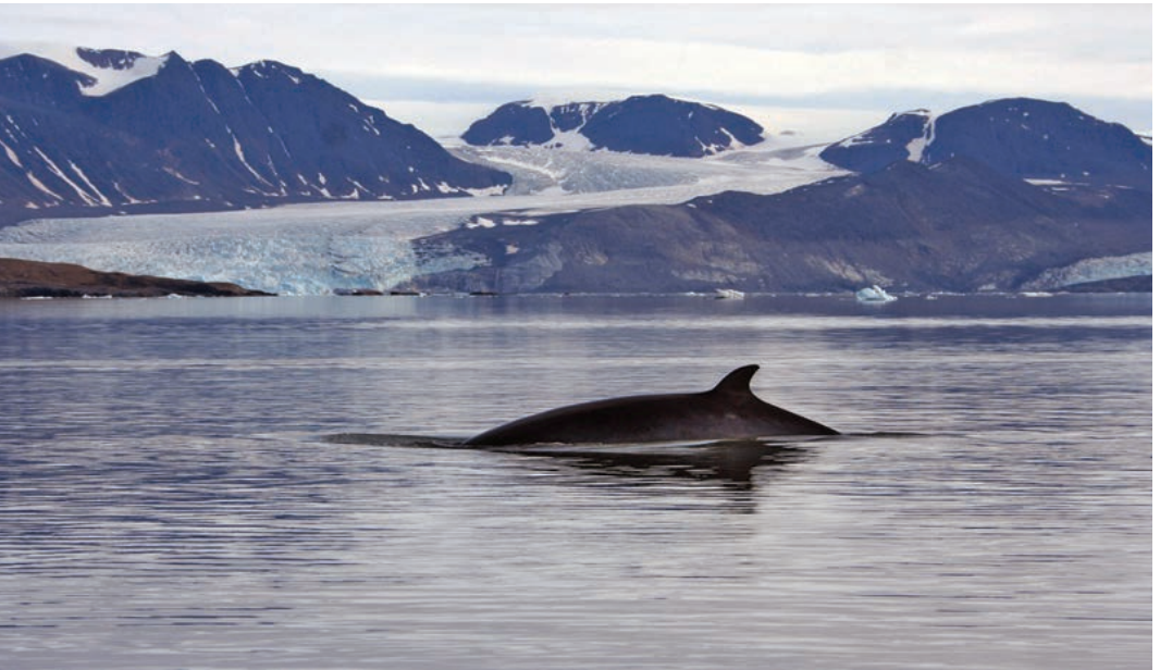
Vågehval på næringsøk.