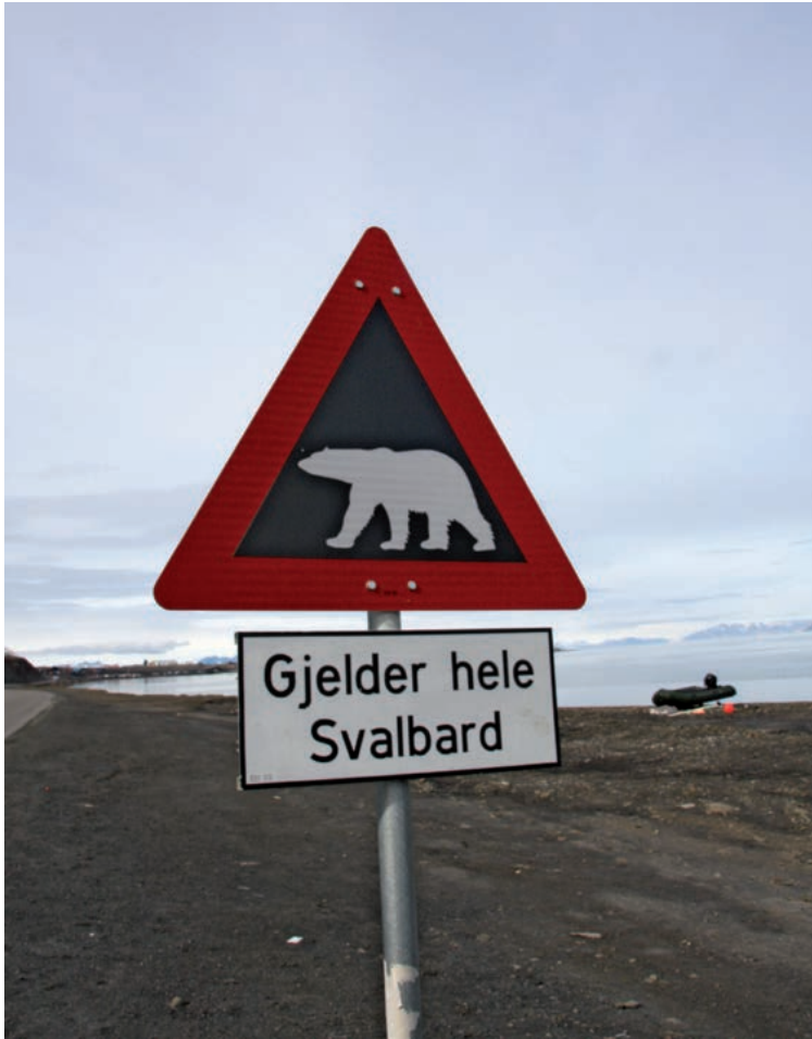
Isbjørn kan dukke opp når og hvor som helst i Svalbards natur. Skilt som dette varsler isbjørnfare ved Longyearbyen.