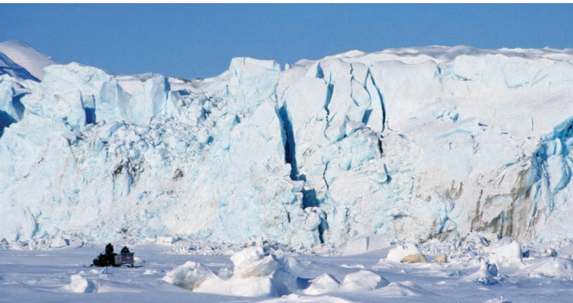
Det er ulovlig å oppsøke isbjørn slik at den blir forstyrret. Her har turister kjørt for nært ei binne med unge. Bruk heller teleskop og observer på avstand.

HUSK: Vær alltid bevæpnet ved ferdsel utenfor bosetningene på Svalbard. Ha skudd i magasinet, men ikke i kammeret. Våpenet må være kraftig nok, med egnet ammunisjon. Tren med våpenet før turen. På vinteren må våpenet være tørrpusset ellers kan ising forårsake funksjonsfeil.