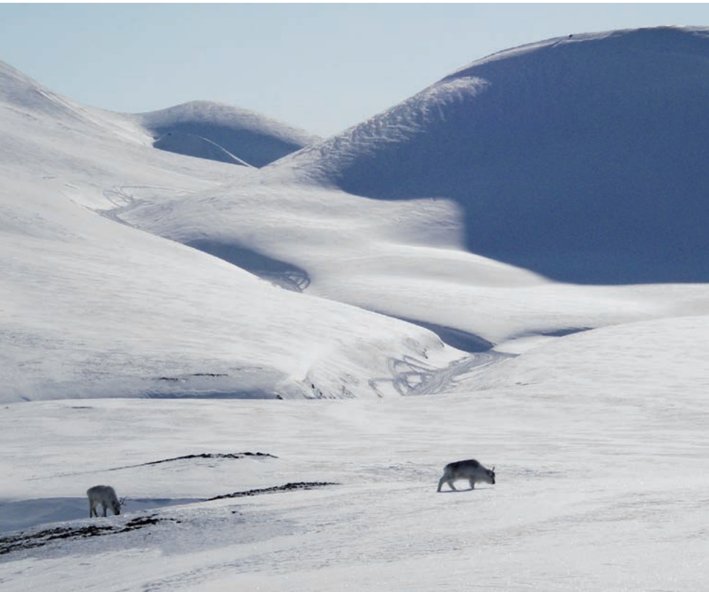
Svalbards natur er sårbar. Snøscootertrafikken bør følge dalbunnen og hovedferdselsårene. Unngå kjøring oppe på brinkene.