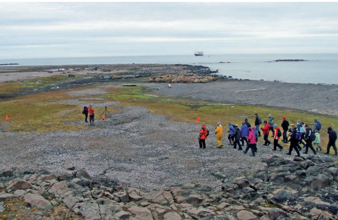
Møte med hvalross på Purchasneset på Lågøya. Besøkende turister og guider opptrer korrekt og holder god avstand til dyrene.

All menneskelig ferdsel (f.eks. fotografering, filming, forskning og næropplevelser med dyreliv) i Svalbards natur kan føre til unødig forstyrrelse av fugler og pattedyr. Målsettingen må være å gjøre forstyrrelsen minst mulig.