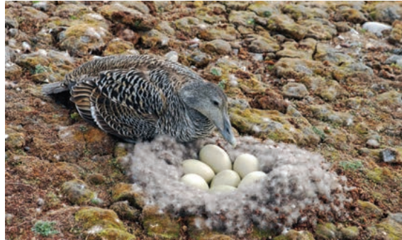
Ærfuglhunn på reir. Hunnfuglen forlater ikke reiret med mindre du kommer for nært, men den stresses av ditt nærvær.

Kortnebbgjess forlater reiret raskere enn hvitkinngjess og ringgjess. Oppfluktavstander for hunnfugler av kortnebbgjess er målt til 20-60 m, mens hanner forlater reiret på større avstander. Ubevoktede reir blir ofte plyndret for egg av fjellrev, polarmåke eller tyvjo. Undersøkelser i Sassendalen på kornebbgjess viste at 35 % av reirene ble røvet etter forstyrrelse.