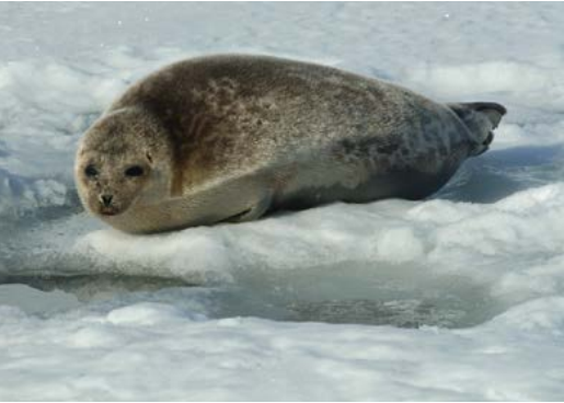
Ringsel på fjordisen i fødetida. Den går raskt i vannet om du kommer for nært.

Ringselen er hyppig å se på fjordisen i kastetida (når den føder) i tidsrommet medio mars-mai. Den er mer sjelden å se på sommeren. Når den oppdages sommerstid er det ofte på isflak nær øyer eller brefronter. Kommer du for nært, slipper den seg ned i vannet. Ofte oppsøker den småbåter av nysgjerrighet, for så å dykke og bli borte når den har sjekket ut inntrengeren.