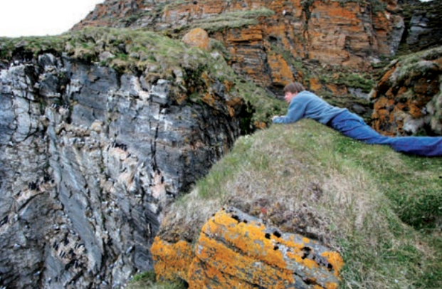
En forsker i fuglefjellet Ossian Sars betrakter fuglene på god avstand.