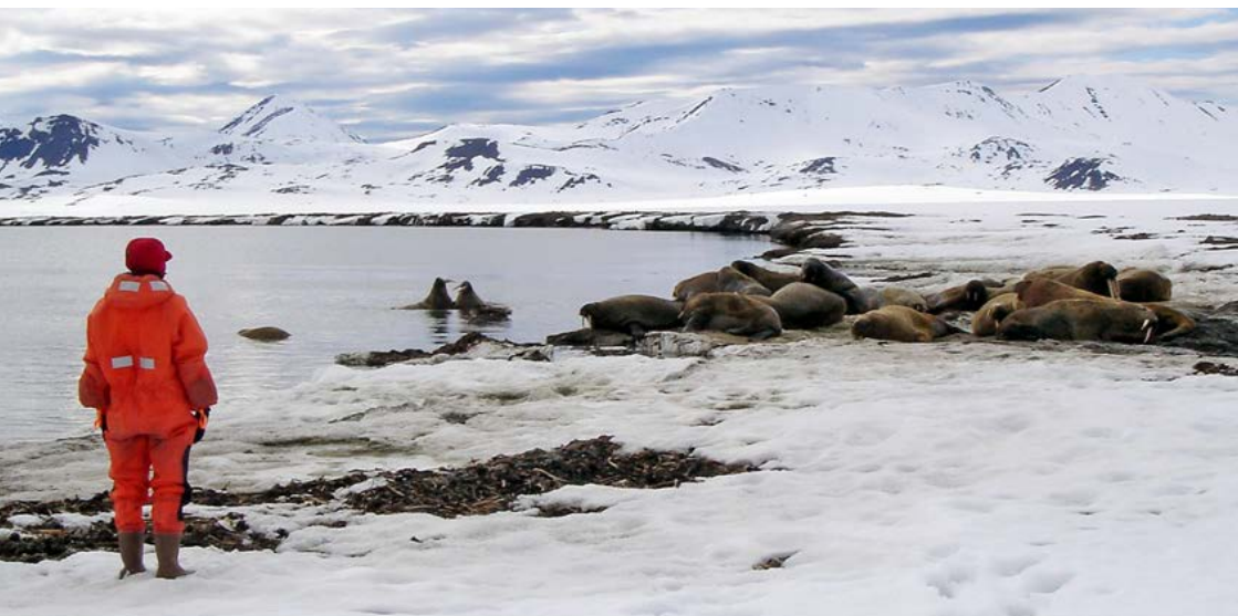
Når de første hvalrossene begynner å løfte på hodet og blir urolige bør en trekke seg tilbake. Her fra Richardlaguna, Prins Karls Forland.