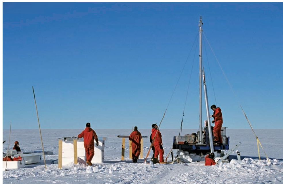
Boring av grunne iskjerner i Antarktis.

Havnivået bestemmes av et stort antall fysiske prosesser i miljøet. Det er derfor en representativ målestav for å overvåke klimaendringer. Det er mer enn 30 målestasjoner for tidevann i Barentshavet, Norskehavet og Grønlandshavet og de fleste viser betydelige endringer av havnivået de siste 20 år. Breer som smelter gir økning i havnivået, og varmere vann utvider seg i forhold til kaldt vann. Endringene kan vitne om global oppvarming i Arktis, sammen med endringer for Den nordatlantiske strøm (Golfstrømmen), mindre havis, økt temperatur i vannmassene i Atlanteren, endringer i havsirkulasjonen, tilbaketrekking av isbreer og økt erosjon langs kysten.