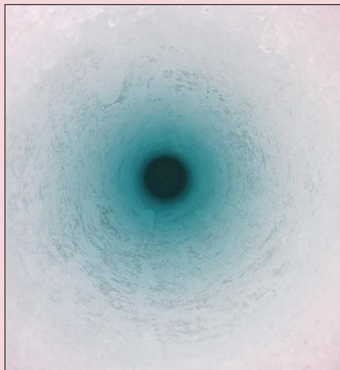
Borehull i havis.

Kanskje det viktigste målet med Polaråret er å etterlate en permanent arv av forbedret arktisk samarbeid. Regjeringen har gjennom Norges forskningsråd bevilget 288 millioner kroner til polarforskning under Polaråret, og i tillegg er det øremerket et titalls millioner til formidlings- og undervisningsaktiviteter. Beløpet vil bli fordelt over fire år.