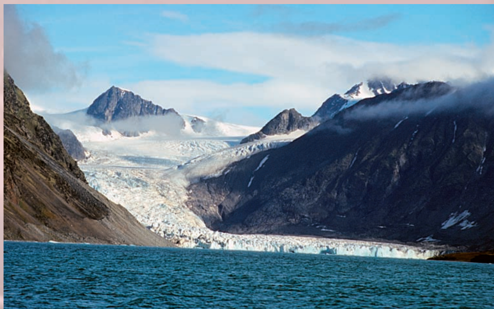
Tinayrebreen, Svalbard.