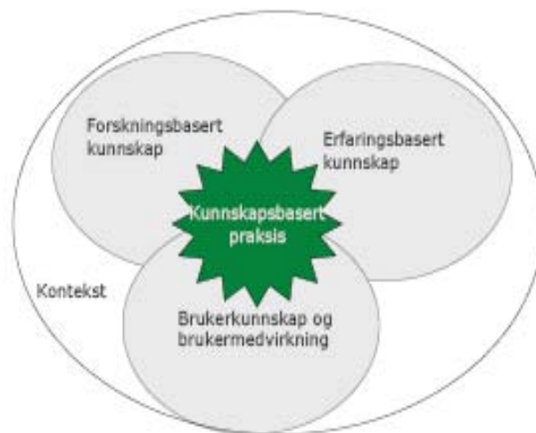
Figur 1: Modell for kunnskapsbasert praksis

Kunnskapsbasert praksis er praktiske handlinger basert på metoder og teknikker som har dokumentert effekt (Nortvedt mfl. 2007). Kunnskapsbasert praksis utvikles i en gitt kontekst med forankring i kunnskapskilder som brukererfaringer, de profesjonelles erfaringer og resultater fra nyere forskning med dokumentert effekt. Det å arbeide kunnskapsbasert er å etterspørre, finne og bruke eksisterende forskning i fagutøvelsen. De profesjonelle må holde seg faglig oppdatert og etterspørre, finne og bruke bevisst oppsummert forskningsbasert kunnskap. Fokus er på anvendt forskning som er rettet mot bestemte praktiske mål eller anvendelsesmåter (Nortvedt mfl. 2007). Figur 1 illustrerer kunnskapskildene som inngår i en kunnskapsbasert praksis.