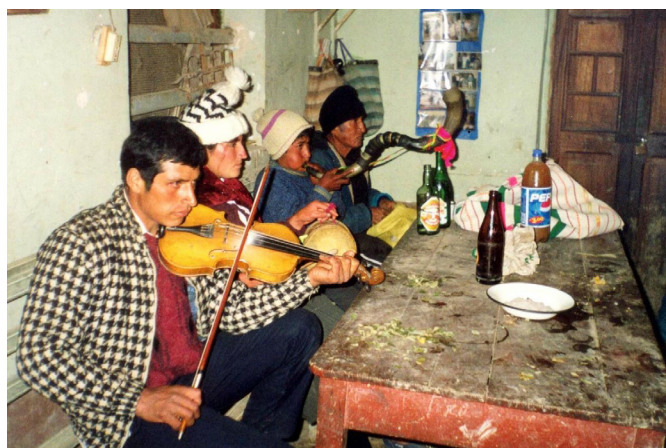
Fig. 2 Músicos e Instrumentos