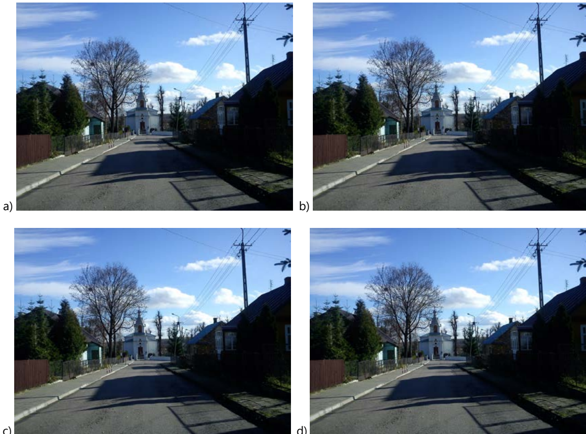
Ryc. 3. Powiązania widokowe w przestrzeni miejscowości: a) widok cerkwi w Krynkach, b) widok kościoła w Krynkach, c) widok cerkwi w Dąbrowie, d) otwarcie krajobrazowe z rynku w Sokółce (wszystkie fot. D. Gawryluk, 2013–2016)