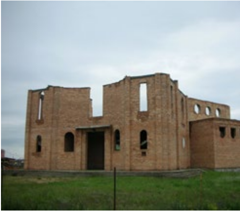
Ryc. 15. Kościół pw. św. Karola Boromeusza, arch. Michał Bałasz, proj. 2000.