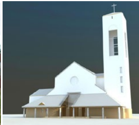
Ryc. 18. Kościół pw. św. Ojca Pio, arch. Adam Suflński.