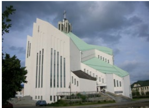
Ryc. 7. i 8. Kościół pw. NMP Matki Kościoła, arch. Andrzej Chwalibóg (1990–1996). Fig. 7. & 8. Church of the Mother of the Church, arch. Andrzej Chwalibóg (1990–1996).