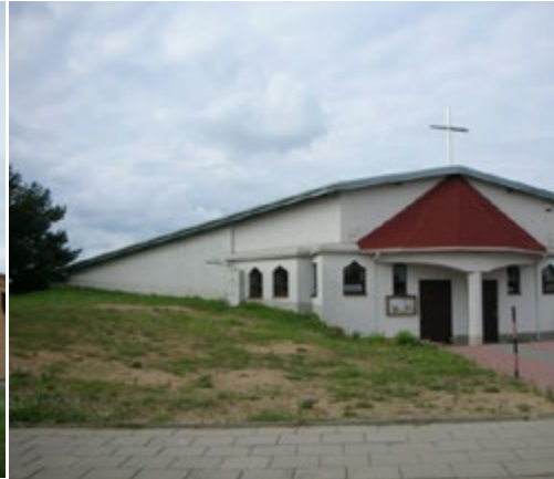
Ryc. 16. Kościół pw. NMP Nieustającej Pomocy, arch. Andrzej Nowakowski, proj. 2000.