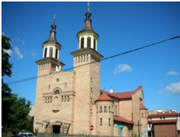
Ryc. 12. Kościół pw. Matki Bożej Fatimskiej, arch. Andrzej Nowakowski (1996–2005)