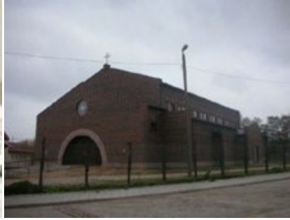
Ryc. 14. Kościół pw. Bł. Bolesławy Lament, arch. Arkadiusz Koc, arch. Iwona Toczyłowska (2004–2009).

Fig. 13. The Blessed Bolesława Lament's church, Conceptual project diorama, I Award, arch. Arkadiusz Koc, I. Toczyłowska, Source: Roman Catholic Congregation of the Blessed Bolesława Lament booklet, Białystok 2005, s. 6.