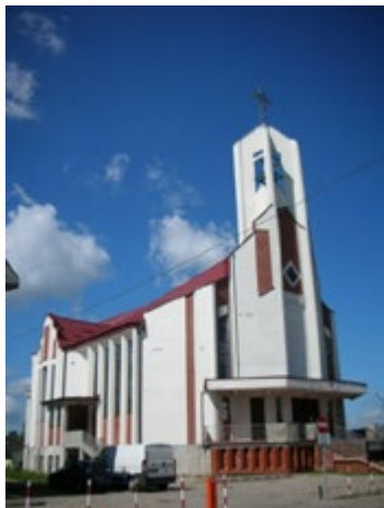
Ryc. 11. Kościół pw. Św. Rodziny, arch. Danuta Łukaszewicz (1993)