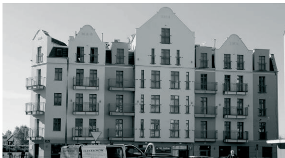
Fot. 5. Hotel Śródka 2015.

W ślad za opisanymi inwestycjami i zmianami, na głównej ulicy pojawiły się nowe lokale gastronomiczne i sklepy. W 2015 roku został oddany do użytku Hotel Śródka. Jest to adaptacja dwóch sąsiednich kamienic z lat 1906 – 1908, tworzących pierzeję naprzeciw kościoła św. Małgorzaty. Obok mieszkań kamienice mieściły lokale usługowe i handlowe. Częściowo zniszczone w czasie wojny zostały odbudowane. Ich gruntowna przebudowa przywróciła centrum dzielnicy budynek o skromnym secesyjnym wystroju i potrzebnej funkcji. „Powróciła” restauracja, która niegdyś znajdowała się w parterze kamienicy narożnej. [22].