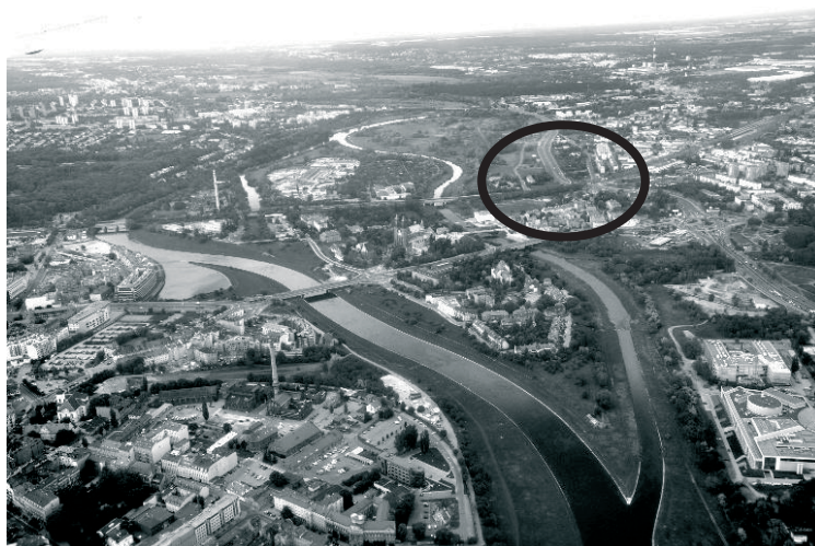
Fot. 2. Widok Ostrowa Tumskiego w widłach Warty i Cybiny, na wschód od niego leży Śródka ograniczona dwiema arteriami, rondem, linią kolejową i korytem Cybiny z odbudowanym już mostem i kładką ICHOT. Fot. aut