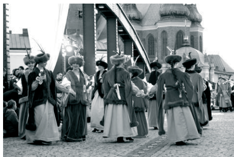
Fot. 4. Cykliczne wydarzenia kulturalne na moście Biskupa Jordana

W ramach programów unijnych zbudowane zostało (2015) Interaktywne Centrum Ostrowa Tumskiego (ICHOT), muzeum, które przedstawia rozwój najstarszych fragmentów Poznania. Umieszczone na śródeckim brzegu Cybiny, z Ostrowem łączy się pieszą kładką umieszczoną w miejscu dawnego mostu i Śluzy Katedralnej. Surowa, niemal sześcienna betonowa bryła muzeum jest na ukos „pęknięta” kadrując widok na katedrę. Konkurs na muzeum, ogłoszony w 2009 roku, wygrała pracownia AD ARTIS Emerla, Jagiełłowicz, Wojda, z Krakowa.