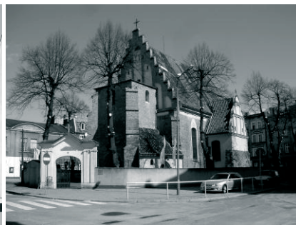
Fot. 6. Kościół św. Małgorzaty. Fot. aut

Działalność Rady Osiedla, która stara się osobność, wydzielenie Śródki przekuć w jej atut była i jest bardzo intensywna. Organizowane już od lat 90. XX w. imprezy integrujące mieszkańców otrzymały wsparcie programu rewitalizacji i dotacji pro-społecznych umożliwiających organizację imprez o szerszym niż dotąd zasięgu. Most Biskupa Jordana od 2007 roku stał się centrum tych działań. Cyklicznymi wydarzeniami są m.in. Śródeckie Spotkania (VIII edycja w 2015 roku), Targi Średniowieczne (VI edycja), Koncerty Śródeckie w kościele św. Małgorzaty, cykl imprez „A w niedzielę po sumie na moście”, Dzień Sąsiada, Przechadzki po Śródce. Dużą rolę odgrywa Ośrodek Szkolno-Wychowawczy dla