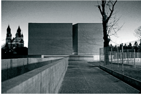
Fot. 7. Brama Poznania ICHOT, 2015.

Dzieci Niesłyszących, placówka mieszcząca się w budynkach po klasztorze Reformatów. Młodzież uczestniczy aktywnie w wydarzeniach dając przedstawienia i popisy, towarzysząc zapraszanym artystom, aktorom, muzykom.