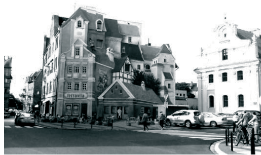
Fot. 8. Mural na ślepej ścianie kamienicy.

Od 2015 roku przestrzeń otwartych tarasów przed ICHOT jest również miejscem wydarzeń kulturalnych dzielnicy. Udział mieszkańców jest coraz większy i coraz większa ich liczba uczestniczy w cyklicznych i jednorazowych wydarzeniach. Współpraca Rady z organizacjami i fundacjami oraz grupami artystów, miała na celu zarówno integrację mieszkańców jak i upiększenie dzielnicy. Spektakularną zmianą okazało się wykonanie (2015 rok) muralu doskonale wpisującego się w przestrzeń przedkościelnego placu. Umieszczona na ślepej ścianie kamienicy wychodzącej na plac kompozycja „uzupełnia” istniejącą zabudowę. Mural "Opowieść śródecka z trębaczem na dachu i z kotem w tle", autorstwa Radosława Barka, w bajkowej konwencji przedstawia spiętrzone kamienice, budynki ze sklepami i ludzi w sytuacjach, jakie mogłyby się wydarzyć w tym miejscu.