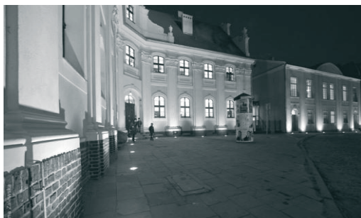
Fot. 3. Katedralna Szkoła Muzyczna w dawnym klasztorze Filipinów i Domu Ludowym.