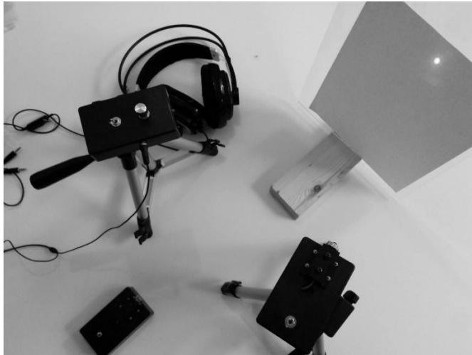
Abbildung 1: Funktionsweise eines Lasermikrofons. Der Laser (unten rechts) wird auf eine reflektierende Oberfläche (oben rechts) gerichtet, während mit einem Empfänger (oben links) der reflektierte Laserstrahl aufgefangen und hörbar gemacht wird.

Auch nach der Ergänzung des § 90 TKG um die «sonstigen Telekommunikationsanlagen» im Rahmen der TKG-Novelle im Jahr 2012 werden kabelgebundene Geräte nicht erfasst. Entgegen der Definition aus § 3 Nr. 23 TKG umfasst der Begriff der Telekommunikationsanlage nur drahtlose Anlagen. 18 Kabelgebundene optische Übertragungen bspw. über Glasfaserkabel werden von der Vorschrift nicht erfasst. Vielmehr wollte der Gesetzgeber die Norm möglichst technikoffen gestalten und sicherstellen, dass auch neuere technische Funktionsprinzipien, wie z.B. Lasermikrofone, durch § 90 TKG erfasst sind. 19