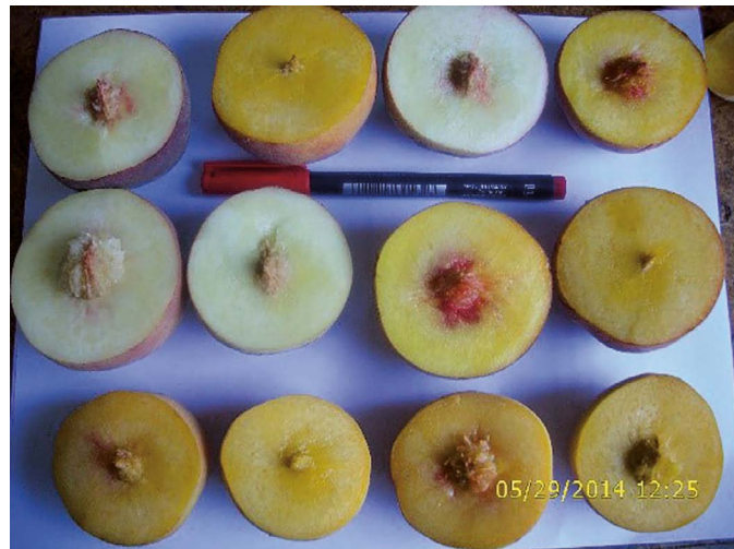
Figura 2. Características visuales de frutos de durazno de las variedades sobresalientes.