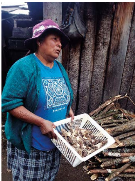
Figura 2. Pastora de la localidad de Agua Blanca.

La recolección de hongos constituye un ingreso para el sustento familiar, donde el 90% de los recolectores utilizan este recurso para venta y consumo propio, el 10% lo consume y/o lo regala a sus familiares cercanos, es