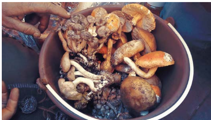
Figura 3. Hongos para venta en el mercado de Texcatitlan.

decir no lo comercializa. Existen dos formas de comercializarlos, la primera consiste en la venta a intermediarios en la misma localidad, en la cual el producto se paga a mitad de precio de lo que se encuentra en mercado, mientras que la segunda es la venta directa al consumidor en mercados locales, los principales lugares de comercialización son Texcatitlán, Zinacantepec, Toluca y Palmillas (Figura 3).