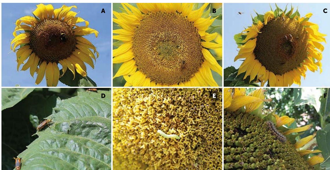
Figura 3. Insectos asociados a las fases antesis tres cuartas partes y casi completa en H. annuus L., en Cuautitlán Izcalli, México. A) Abejero. B) Abeja. C y D) Cantáridos. E) Oruga medidora. F) Oruga cortadora.

cia de insectos plaga, tales como Rachiplusia nu , Hylesia nigricans , Trialeurodes vaporariorum y Nezara viridula .