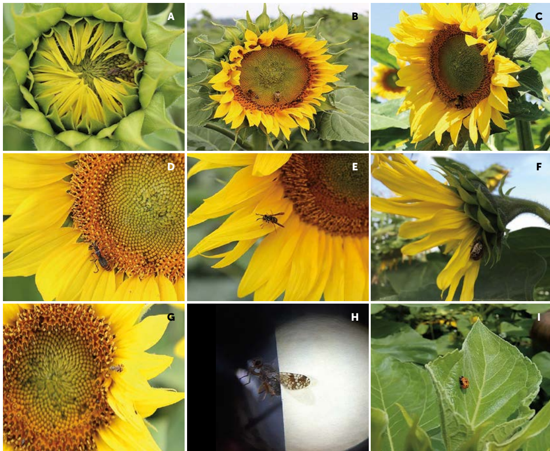
Figura 1. Insectos asociados a la fase principio de la antesis en H. annuus L., en Cuautitlán Izcalli, México. A) Mosca del fruto en oviposición. B) Abejas. C) Abejorro. D) Cantárido. E) Avispa. F) Catarina calígrafa. G y H) Mosca del fruto. I) Pupa de Catarina.