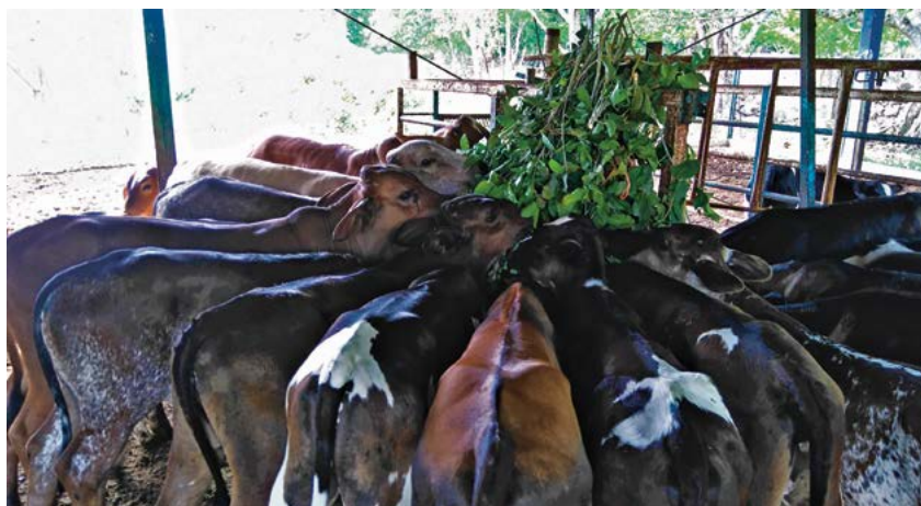
Figura 2. Becerras alimentados con follaje de árboles de especies tropicales.

through livestock – A global assessment of emissions and mitigation opportunities. Food and Agriculture Organization of the United Nations (FAO), Rome.