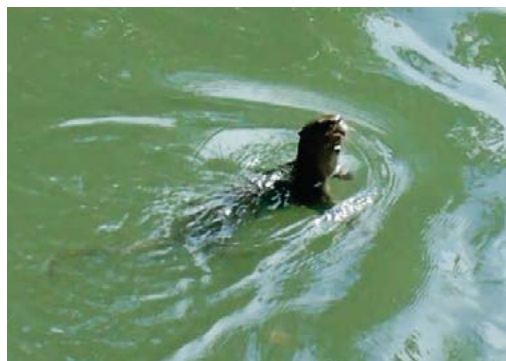
Figura 1. Ejemplar de nutria neotropical de río ( Lontra longicaudis ) en la presa de Las Sirenas.

El día 10 de noviembre del año 2015, a las 12:30 h, durante un recorrido en una zona de ecotono entre bosque mesófilo de montaña y bosque tropical perennifolio, con algunos elementos propios de la vegetación de galería ( Platanus mexicana Moric. y Salix humboldtiana Willd.), según Rzedowski (1978), se registró por primera vez a la nutria de río ( Lontra longicaudis ), mediante un avistamiento de un ejemplar adulto (Figura 1), en los límites del Parque Nacional Cañón del Río Blanco. Las coordenadas geográficas del lugar son 18° 49' 48.73" N y 97° 04' 6.90" O, a una altitud de 1,153 m (Figura 2), en la frontera de los municipios de Ixtaczoquitlán y Rafael Delgado, en el río Matzinga, un pequeño afluente, a sólo 300 m de su desembocadura con el río Blanco, en una represa conocida como "Las Sirenas".