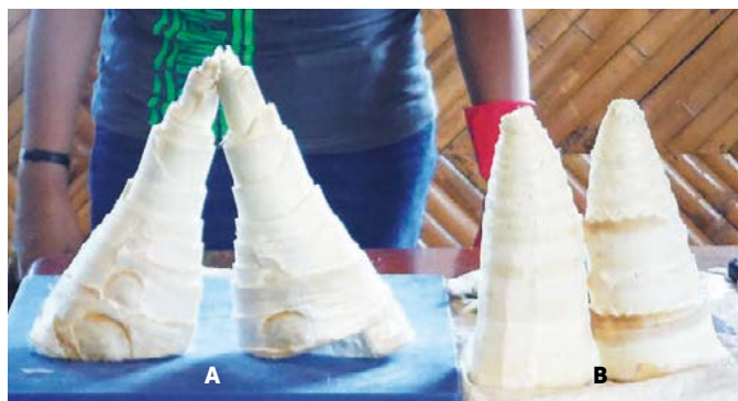
Figura 4. Brotes de bambú limpios.

Si se requieren cortes más pequeños, se deben cortar longitudinalmente. Esto se recomienda para hacer guarnición excelente y más adelante servir al plato (Figura 5).