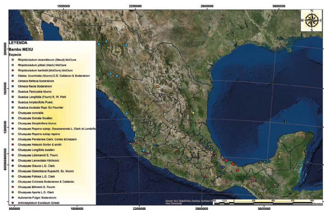
Figura 7. Distribución de especies de bambú en México. Elaboración propia con datos de herbarios.

potencial ecológico y alimenticio, además de industrial y medicinal, que puede favorecer el desarrollo de las poblaciones enclavadas en las áreas tropicales de México (Figura 7).