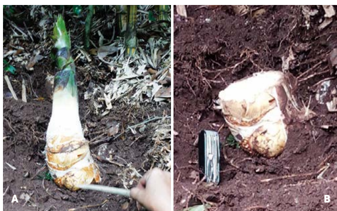
Figura 2. A: Brote de bambú de 40 cm de altura. La parte señalada es el "ojó" del brote. B: Corte realizado a siete cm del "ojó" del brote. Huerto comercial en Puebla, México