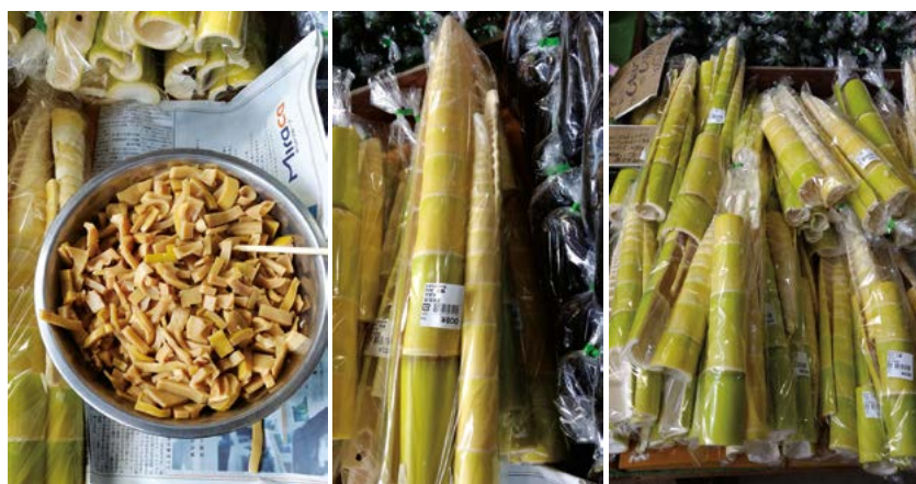
Figura 1. Bamboo shoot, cocido y crudo en un mercado de productos orgánicos en Tsukuba, Japón.

del bambú que, si no se cosecha, será un bambú adulto en 3-4 meses. Los brotes usualmente emergen en la temporada de lluvia, y son cosechados cuanto tienen una altura aproximada de 20-30 cm. La exposición a la luz causa sabor amargo, a medida que se forman glucósidos cianogénicos en los brotes. En Japón, los brotes de bambú se siembran bajo “mantillo” para crecer, calentado con cables eléctricos que se colocan de 6-8 cm por debajo del suelo. El uso del brote de bambú como comida, data desde los comienzos de la civilización en lugares endémicos de las especies de éste. Con el crecimiento de la civilización China hacia Japón, países como Birmania, Tailandia y Vietnam han aprendido el valor nutricional de los brotes de bambú (Satya, 2012). El brote de bambú es consumido por distintas clases sociales en el mundo y en la actualidad se considera un recurso comestible potencial (Dransfield y Widjaja, 1995). En 1951 se reportó la primera producción de brotes de bambú como alimento en el Este de China y Japón. Hoy día China y Taiwán son los países que exportan más bambú comestible. El brote de bambú se define como “el nuevo crecimiento del apéndice del rizoma en un culmo joven, y consiste en entrenudos jóvenes