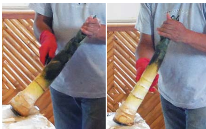
Figura 3. Forma correcta de manejar el brote de bambú y realizar el corte de las hojas envainantes.

asegurándose de cortar exactamente por encima de la porción suave comestible (Figura 3).