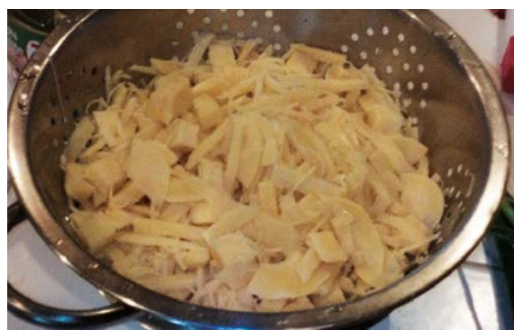
Figura 6. Brotes de bambú picados y hervidos.