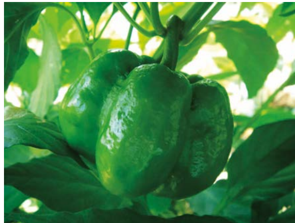
Figura 3. Variedad D-210. Frutos de forma cuadrada, Longitud media y diámetro grande

masal mediante tres ciclos de selección permitió avances importantes en el mejoramiento de dos variedades, agrónomicamente sobresalientes, y la variedad D-210 destacó por peso individual y tamaño de fruto.