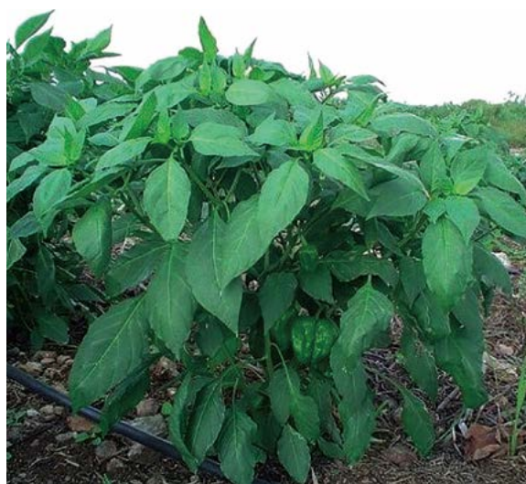
Figura 1. Planta de chile dulce en etapa de fructificación en condiciones de campo.

plante se realizó a los 35 días después de la siembra, cuando las pantas alcanzaron entre 15 a 20 cm de altura. El ciclo cero de cada variedad de chile dulce y sus respectivos ciclos de selección (C1, C2 y C3) se establecieron en un diseño de bloques completos al azar con tres repeticiones. La unidad experimental consistió de dos surcos con 20 plantas cada uno, a una distancia entre surcos de 1.2 m en Conkal, y 1.5 m para Ejido Juan Sarabia, y 0.3 m entre plantas en ambas localidades. El manejo agronómico del cultivo se hizo en base a lo sugerido por Soria et al. (2002).