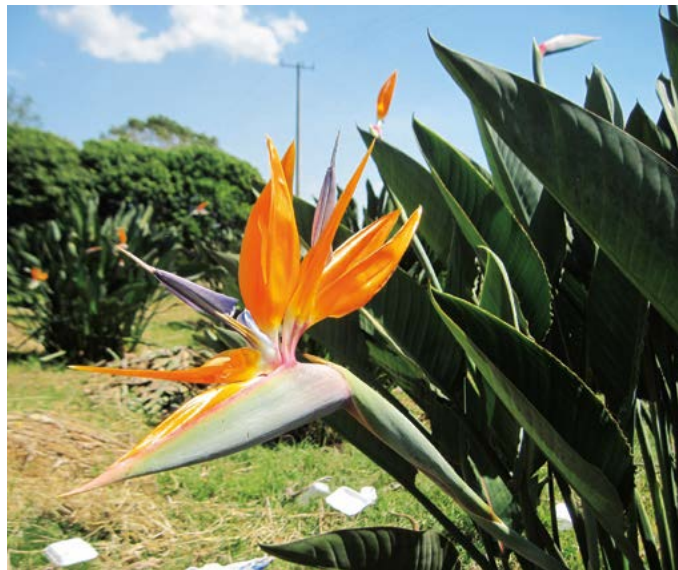
Figura 1. Tallo floral de Ave de Paraíso ( Strelitzia reginae Aiton).

La investigación se realizó, en la Unidad Académica de Agricultura de la Universidad Autónoma de Nayarit,