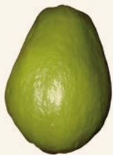
Figura 5. Frutos sanos de chayote con calidad exportación.