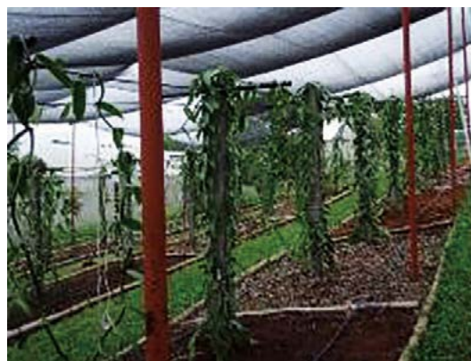
Figura 2. Plantas de Vanilla planifolia Jacks. ex Andrews en alta densidad bajo malla sombra.

la importancia de la orientación en el desarrollo de las guías. La cobertera afecto el vigor de las plantas que fueron clasificadas en débil (brotes menores de un metro y diámetro tallo menor de 1 cm), normal, (brotes de 1.5 m y diámetro de tallo de 1 cm) y vigoroso, (brotes mayores de 1.5 m y diámetro de tallo mayor de 1.5 cm). A los 14 meses de establecida, las plantas desarrollaron inflorescencias y la mejor respuesta fue en cobertera de hoja de plátano (Cuadro 1), registrando además que plantas orientadas al oeste produjeron mayor número de inflorescencias. En comparación a métodos tradicionales de cultivo, la primera floración se presenta a los tres años.