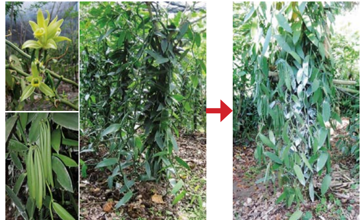
Figura 3. Caracteres que determinan mayor rendimiento en plantas de vainilla.