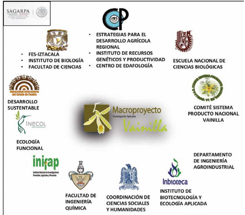
Figura 2. Instituciones de investigación científica y educación superior que participaron en el Macroproyecto de Investigación Aplicada Vainilla planifolia con el auspicio del Consejo Nacional de Ciencia y Tecnología y la Secretaría de Agricultura, Ganadería, Desarrollo Rural y Pesca.

tiva. El impacto de los resultados fue más evidente en la Región Huasteca, con aumento del rendimiento de frutos verdes de 0.60 t ha -1 a 12 t ha -1 , y aumento del precio de venta de fruto verde de $20.00 a $200.00 por kg del 2010 al 2016. El macro proyecto, integró fortalezas de diversas instituciones nacionales (Figura 2), que reivindican el compromiso social de la ciencia para mejorar las condiciones y sostenibilidad en la vida de México con un enfoque final transdisciplinario.