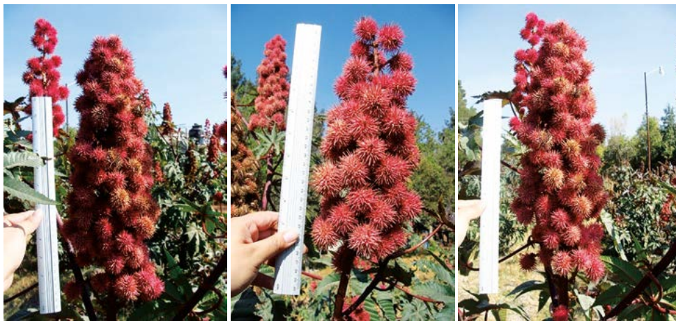
Figura 1. Racimos producidos por la accesión SF7 de Ricinus communis L.

se encontraron diferentes correlaciones entre variables, pero en este análisis destacaron: el peso de cápsulas por planta vs. el rendimiento de semillas ( 0.9126 Pr=0.0001 ) y el número de frutos contra número de racimos ( 0.8562 Pr=0.0001 ).