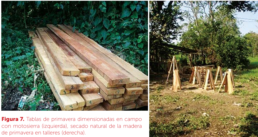
Figura 7. Tablas de primavera dimensionadas en campo con motosierra (izquierda), secado natural de la madera de primavera en talleres (derecha).