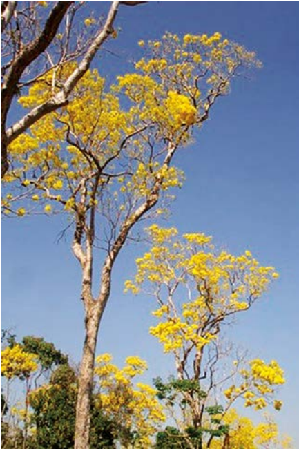
Figura 2. Flores de primavera (arriba), este árbol se distingue en los primeros meses del año por su abundante floración de color amarillo (abajo).