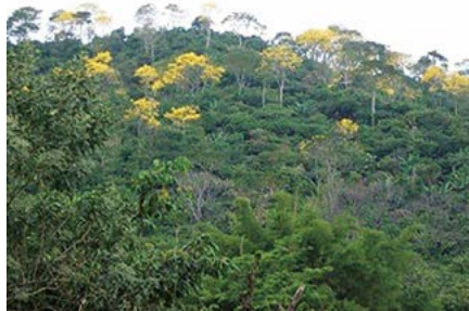
Figura 3. La primavera se produce principalmente en sistemas agroforestales, su función es proporcionar sombra, luego de algunos años su madera es aprovechada.