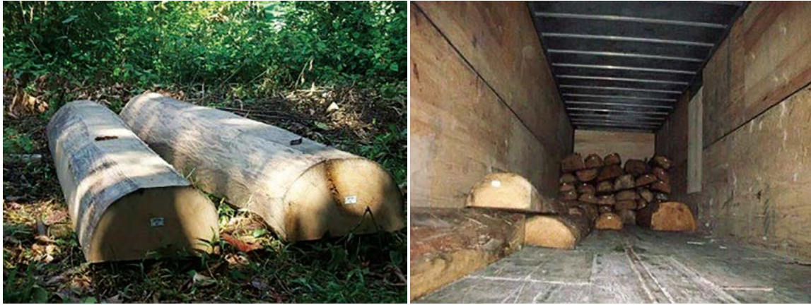
Figura 6. Madera de primavera ( R. donell-smithii ) preparada para embarque para "flitch" (izquierda), y en cajas secas para su traslado a la República de Guatemala (derecha).