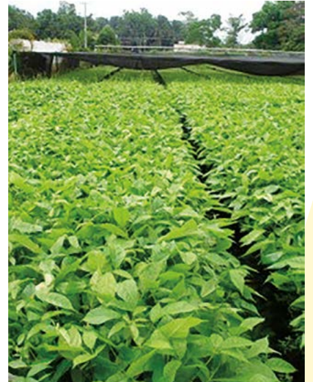
Figura 4. La producción de plantas forestales se hace con diferentes paquetes tecnológicos, en todos se recurre al uso de semillas colectadas regionalmente, un kilogramo de semilla de primavera tiene entre 220,000 y 250,000 semillas.