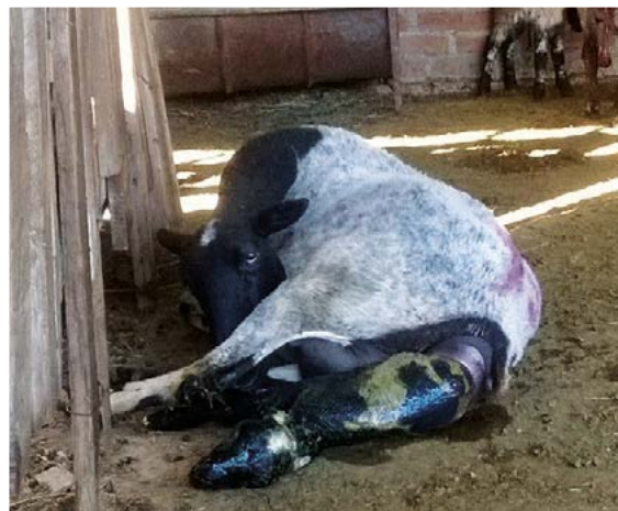
Figura 2. Parto de oveja tratada con SeMet.