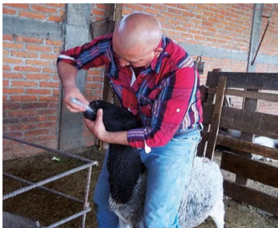
Figura 1. Complementación con SeMet a ovejas gestantes vía oral

donde, ovejas con nutrición restringida tienen fetos de masa reducida en comparación con ovejas que tienen nutrición balanceada (Lekartz et al. , 2010), el mal estado de salud y baja condición corporal son determinantes para el desarrollo del feto, lo que suele resultar en retraso productivo futuro, esta disminución del rendimiento productivo puede ocurrir aun cuando el peso al nacimiento no se vea afectado (Meyer et al. , 2011). La provisión de Selenio a la madre durante la gestación y lactación es eficaz para cubrir los requerimientos en el recién nacido (Figura 2) debido a que el Selenio cruza eficientemente la barrera placentaria, además de concentrarse en el calostro y la leche (Hall et al. , 2014; Zarczynska et al. , 2013), la forma orgánica de Selenio es más eficaz que las formas inorgánicas en su capacidad para transferir Selenio a lactantes humanos y de otras especies mediante el amamantamiento, reduciendo el riesgo de deficiencia en la descendencia (Rayman et al. , 2008). Con base en lo anterior, se realizó un estudio para identificar la influencia de Selenio en el peso al nacimiento y ganancia de peso de corderos nacidos de madres com-