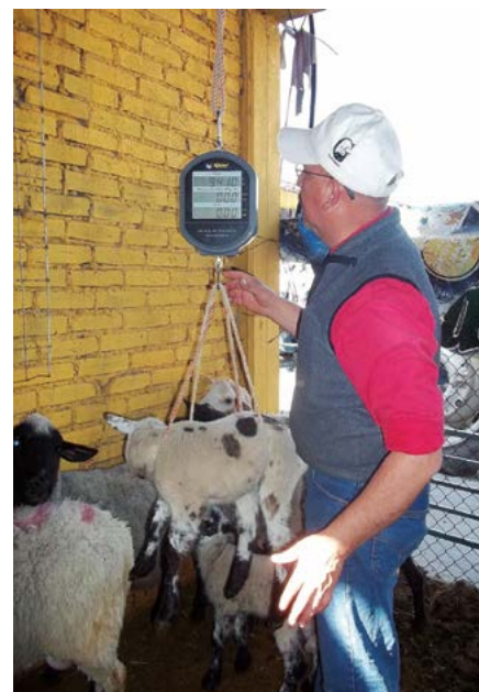
Figura 3. Pesaje de corderos hijos de ovejas con SeMet y sin SeMet.

La concentración de Selenio en suero sanguíneo de ovejas (Cuadro 1) entre los grupos en estudio evidenciaron aumento en ovejas tratadas con SeMet el día 25 ( P < 0.05 ), y coincide con lo mencionado por Carlson et al., (2009) y Stewart et al., (2012). La concentración sérica de Selenio en corderos a los seis días de edad no indicó diferencia, mientras que a los 25 días de vida se observó diferencia predominando la concentración media de Selenio en