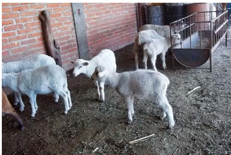
Figura 6. Corderos hijos de ovejas complementadas con SeMet y sin SeMet.

a Desviación estándar; b Ovejas testigo; c Ovejas con adición de selenometionina.