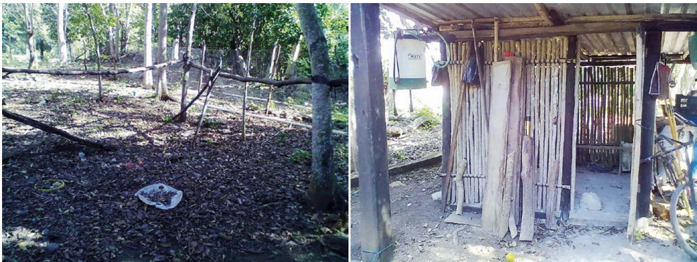
Figura 4. Gallinero rústico en un traspatio del ejido Adolfo Ruiz Cortines en el estado de Campeche, México.

zan como animales de doble propósito, es decir tanto para producción de huevo como de carne y en éstas la madurez sexual se alcanza a las 20 semanas, aunque aseveraciones de productores de traspatio señalan que estas aves rompen postura a los seis meses de edad (Cuca et al. , 2011) y la cantidad de huevo varía dependiendo del número de periodos de postura de cada hembra.