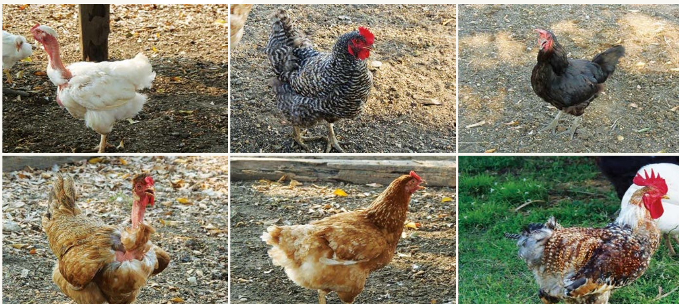
Figura 3. Algunos fenotipos de gallinas criollas ( Gallus gallus ) en México.

El gallinero generalmente está hecho de varas, barrotes, tablas y láminas; su tamaño depende de las posibilidades económicas, de la atención y necesidades de la familia (Cuca et al. , 2011). El peso de los pollitos al nacimiento varía de 25-35 g, y en estado adulto de 1 a 2.5 kg, aunque algunos gallos llegan a pesar hasta 3 kg. La madurez sexual en machos se alcanza entre las 16 y 20 semanas de edad, aunque lo ideal es utilizarlos después de 20 a 24 semanas. En general, las hembras en el traspatio se utili-