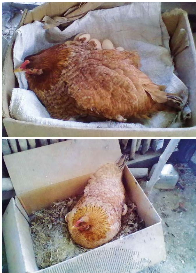
Figura 5. Cloquez o anidamiento de las gallinas criollas ( Gallus gallus ).

La alimentación de las aves de traspatio consiste en lo que las aves pueden recoger como hojas, hierbas tiernas, forrajes, insectos, sobrantes de comida, frutas y tortilla los cuales deben ser del día para evitar enfermedades de tipo digestivo. También se proporcionan granos como maíz, trigo, sorgo o arroz los cuales utilizan estas familias para su consumo. Se ha observado que existen