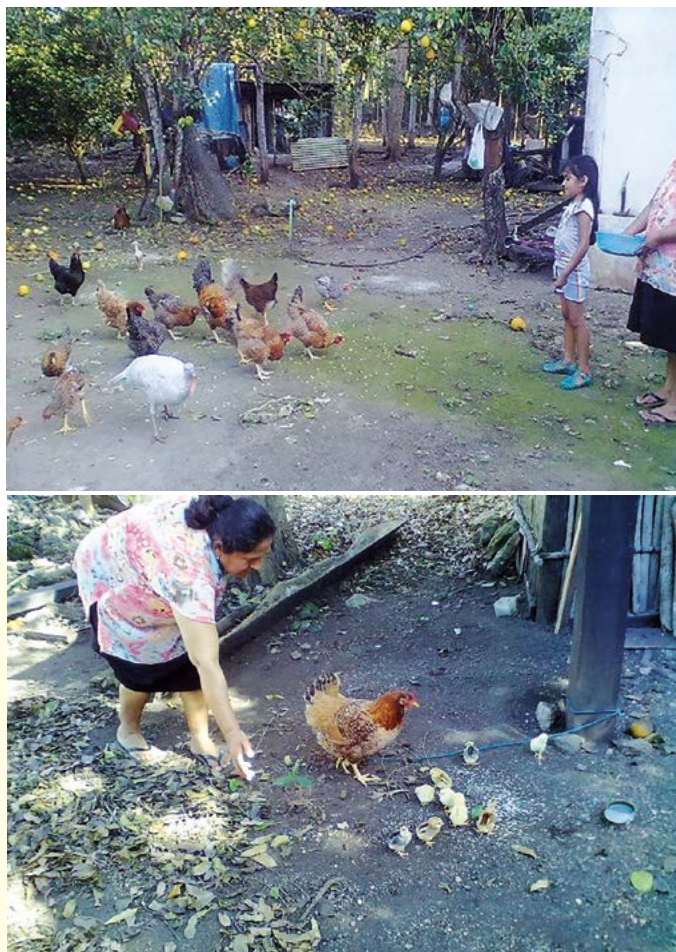
Figura 6. Alimentación de gallinas ( Gallus gallus ) en el traspatio.

casos donde los animales están en encierro y se les proporciona alfalfa ( Medicago sativa ), acahual ( Bidens odorata ) o la hierba de tototl ya sea en el suelo o colgadas. El cuidado de las aves se lleva a cabo principalmente a cargo de las mujeres, ancianos y niños (Figura 6).