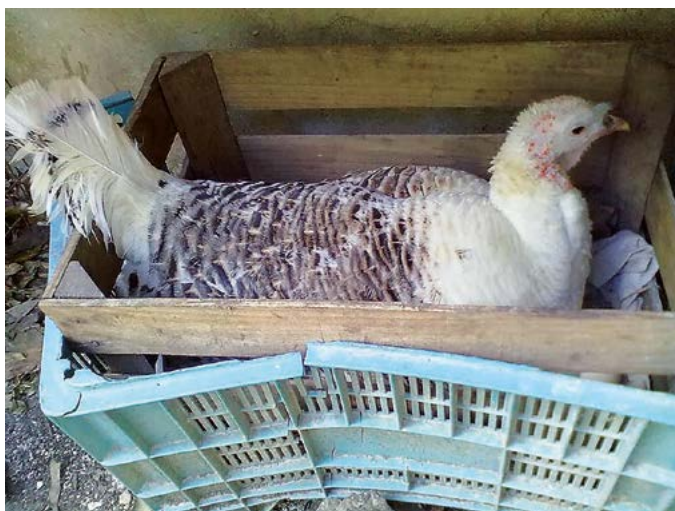
Figura 2. Incubación de huevos de guajolota.

como la Rhode Island y New Hampshire han deteriorado progresivamente su potencial genético para producir en campo abierto o pastoreo volviéndose cada vez más dependientes de insumos externos los cuales son costosos como el alimento balanceado y vacunas; se considera que esto es un error ya que las gallinas criollas han resistido enfermedades y pueden proporcionar a la investigación aves con una gran variabilidad genética útil para obtener animales resistentes. La población de gallinas criollas en México deriva de varios fenotipos entre los que se pueden señalar las gallinas avadas o empedradas, cuello pelón, amarillas, negras, coloreadas y otras menos comunes como las de plu-