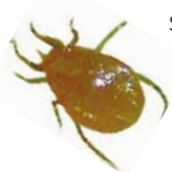
Cuadro 3. Costo total de producción, de control de plagas y de aplicación de acaricidas por tipo de productor en papayo ( Carica papaya ) en el Centro de Veracruz.