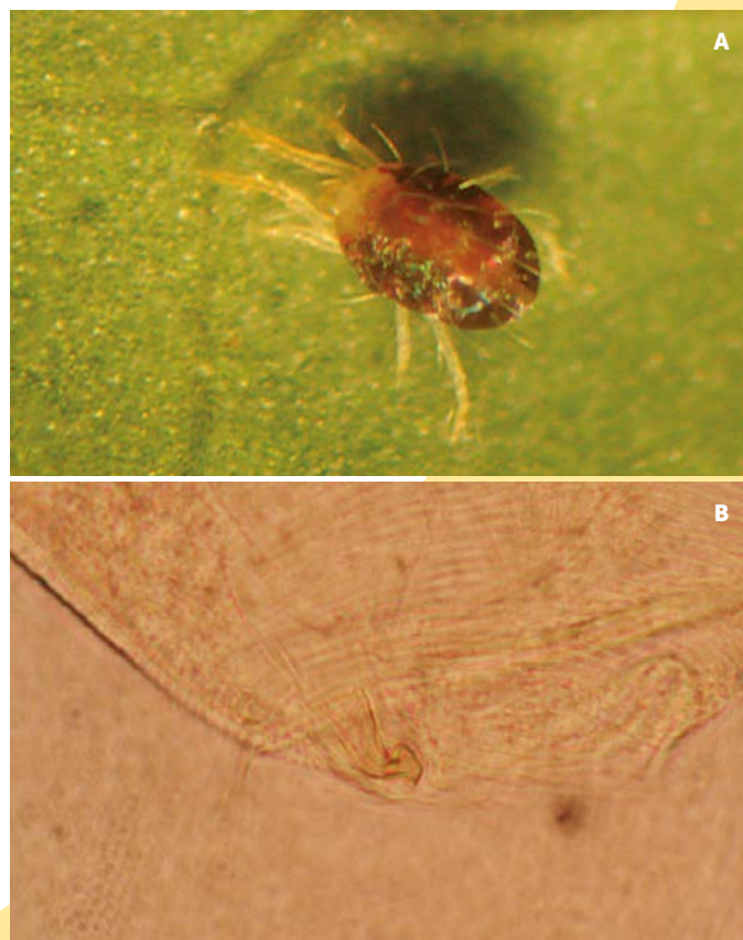
Figura 1. Ácaro plaga del papayo ( Carica papaya ). A: Adulto de Tetranychus merganser , B: Edeago de T. merganser .

Autores como Reyes (2012) han demostrado que el ácaro depredador Phytoseiulus persimilis , obtenido comercialmente, se alimenta de todos los estados de desarrollo de T. merganser (Figura 1), aunque sus parámetros poblacionales indican que no se establecerá en la huerta si se alimenta únicamente de este ácaro. Este depredador puede utilizarse como control biológico de ácaros del papayo por inundación, cuando las poblaciones de depredadores naturales no estén en los niveles poblacionales adecuados. Para que el control biológico pueda ser la base del manejo de ácaros plaga en esta región, debe ser eficiente y a costos competitivos (Romo et al., 2007). Actualmente todos los ácaros depredadores comerciales utilizados en México, incluyendo P. persimilis (Figura 2), son importados de Holanda y EUA, a un costo