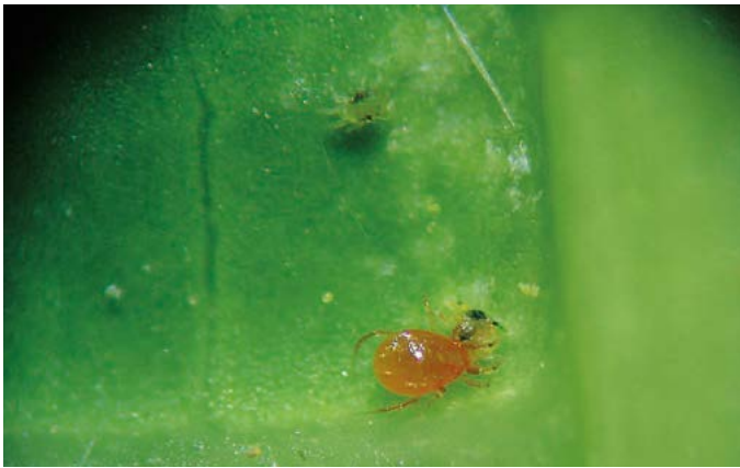
Figura 2. Ácaro adulto Phytoseiulus persimilis , depredando sobre ninfas de tetraníquidos en papayo ( Carica papaya ).

cercano a $5,000 pesos por hectárea, según la especie y presentación del producto, considerando que la dosis mínima recomendada en frutales es de 60,000 depredadores por hectárea. La producción de un organismo de control biológico requiere de instalaciones adecuadas, tal y como lo especifica la Organización de Protección de las Plantas (NAPPO, 2004). Además, deben realizarse procesos meticulosos, que incluyen el transporte y la aplicación del producto. Lo que motivó a evaluar la viabilidad técnica y económica de establecer un Centro de Reproducción Masiva de P. persimilis (CEREMAPP) cercano a la zona productora de papayo del estado de Veracruz.