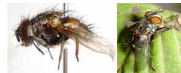
Fig. 6. Adulto de C. reclinata ; A. Macho; B. hembra.

Adulto. El adulto es un insecto de cuerpo blando y mediano, de 7 a 8 mm de tamaño; presentan antenas de tres segmentos con arista desnuda. El cuerpo es color oscuro con líneas grises sobre el dorso de tórax y ojos rojizos; como todos los miembros de la familia Tachinidae presenta el escutelo prominente. Existen ciertas diferencia entre hembras y machos; la más visible es la mancha naranja que presentan los machos sobre la región pleural de los primeros segmentos del abdomen (Figura 6)