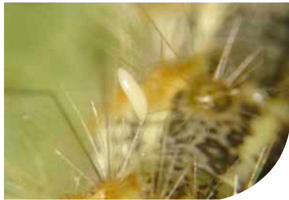
Fig. 1. Huevecillo de C. reclinata insertada en una seta del huésped.