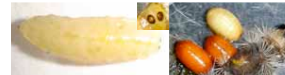
Fig. 5. A. Larva de tercer ínstar de C. reclinata (Robineau Desvoidy) mostrando los espiráculos caudales. B. Pupa recién formada.

Pupa. Mide de 8 a 9 mm de longitud, es subelíptica y robusta en la parte media, con extremos redondeados suavemente; el eje longitudinal es recto. La segmentación está representada por líneas débiles de tonalidad blanco cremosa al principio; conforme transcurre el tiempo se torna café rojiza, hasta alcanzar un color café oscuro lo que indica que la emergencia del adulto se acerca (Figura 5 B).