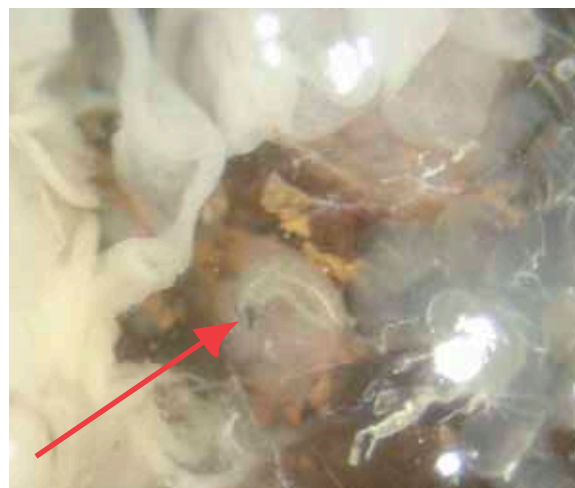
Fig. 4. Larva de 1er. ínstar de C. reclinata

habían muerto. Por lo tanto, esta dieta no es la adecuada para C. reclinata . Se optó por utilizar un hospedante alternativo. Se utilizaron pupas no parasitadas de otro lepidóptero ( Nymphalis antiopa L.), en las que se realizó un corte transversal en los últimos segmentos del abdomen para introducir larvas de C. reclinata y que continuaran su desarrollo. A pesar de que se logró mantener vivas las larvas por más tiempo, éstas finalmente no se adaptaron al cambio y murieron. Al realizar las disecciones, las larvas se encontraron muy cercanas a las tráqueas del hospedante (Figura 4) lo que hace inferir que, como lo señala Clausen (1940), éstas anclan los espiráculos a las tráqueas del