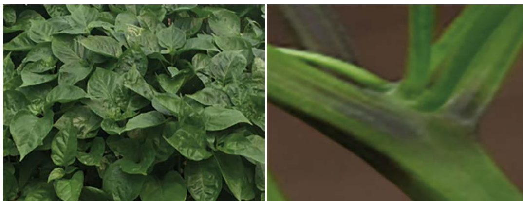
Figura 2. Características del tallo y hoja del Capsicum chinense Jacq. var. Rosita Rosita.

El habanero Rosita presentó hojas deltoides, ligeramente onduladas y parénquima esponjoso en el haz, color verde oscuro brillantes con margen de la hoja ligeramente ondulado, y tamaño que alcanza los 19 cm de largo por 11 cm de ancho, con disposición de las ramas en forma helicoidal (Cuadro 1), resultados que están de acuerdo con lo establecido González et al. (2006) en su descripción de las características del chile habanero. Producto del hábito de crecimiento semi perenne de la planta, se pueden obtener dos ciclos de cultivo consecutivos en