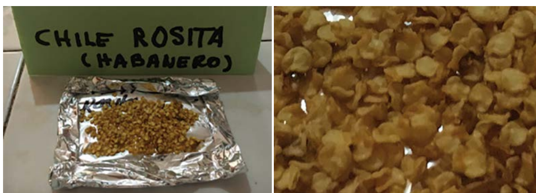
Figura 5. Semilla de chile habanero ( Capsicum chinense Jacq.) var. Rosita.