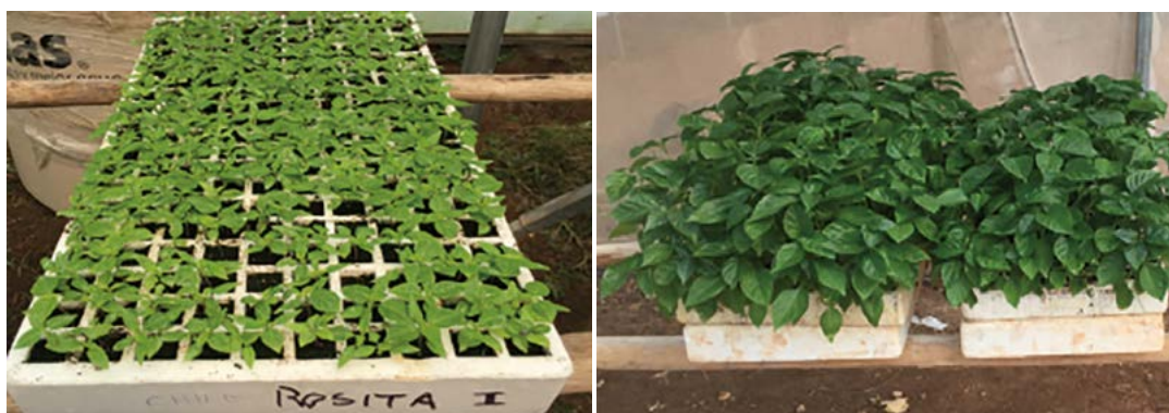
Figura 1. Plántula de chile habanero ( Capsicum chinense Jacq.) var. Rosita 20 y 45 días después de la siembra

Después del trasplante presentó como características distintivas un crecimiento semi-perenne vigoroso, altura mayor de 1.80 m, tallos prismáticos, con pubescencia y presencia de antocianinas en los nudos de las bifurcaciones de las ramas (Figura 2), concordando en parte con González et al. (2006) quienes mencionan que en condiciones de cultivo de cielo abierto, una planta de hábito de crecimiento intermedio, altura de 0.40 a 1.0 m, en condiciones protegidas, la altura de la planta puede rebasar 1.5 m.