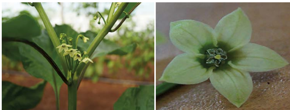
Figura 3. Flores axilares; flor la cual muestra su color y la mancha de la corola.