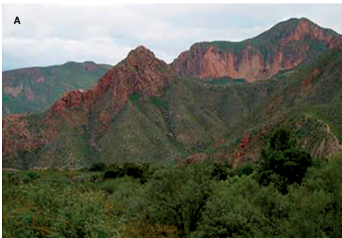
Figura. 5. Grandes superficies del territorio nacional se encuentran en condiciones de baja cobertura de suelo.

Se ha estudiado el efecto de dióxido de titanio (TiO 2 ) en forma de nano partículas y no nano sobre la germinación y crecimiento de plántulas de espinaca evaluados por Zheng et al. (2005), quienes reportaron incrementos de 0.25% a 4% en la germinación y vigor de semilla estimulada con la forma nano particulada (NP). Gracias a su densidad de semilla por kilogramo y a su rapidez para establecerse, las gramíneas representan un aliado para proteger al suelo de la erosión. En estudios realizados, las plántulas presentaron mayor peso seco, concentración de clorofila y tasa