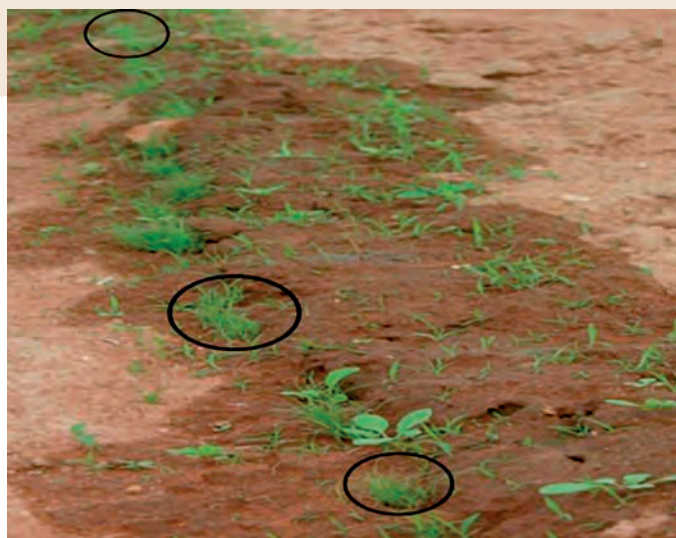
Figura 7. Siembra discontinua de cariósidos permite diferenciar la especie de interés