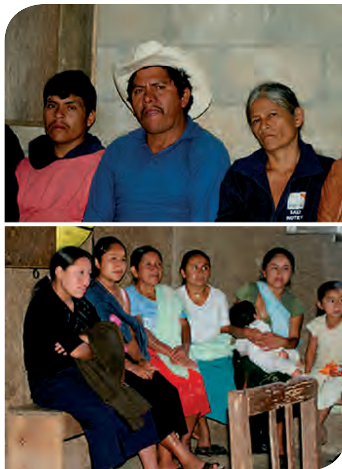
Figura 1. Pobladores zoques del estado de Chiapas, México

En la vertiente del Golfo de México los zoques se concentran en los municipios de Amatlán, Chapultenango, Francisco León, Ixhuitán, Ixtacomitán, Ostuacán, Solosuchiapa y Tapilula; en la Depresión Central se encuentran los de Copainalá, Chicoasén, Ocozocoautla y Tecpatán y, finalmente, en la sierra Madre de Chiapas en los municipios de Coapilla, Ocoatepec, Pantepec, Rayón y Tapalapa. Este territorio, ubica-