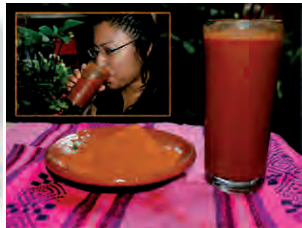
Figura 6. Tascalate elaborado a partir de cacao, maíz molido, azúcar y achiote.