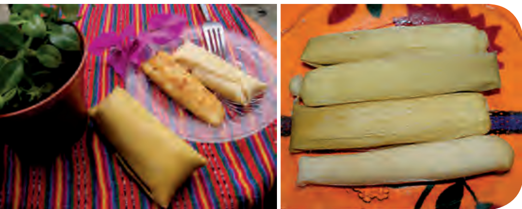
Figura 2. Tamal dulce o salado elaborado con maíz en estado “camagua”, denominado “Picte”, en la región zoque del estado de Chiapas, México.