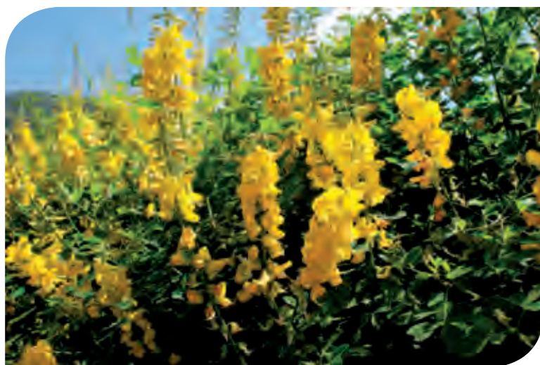
Figura 5. Planta arbustiva y flor de chipilín ( Crotalaria longirostrata L.). Se consumen las hojas tiernas.

por excelencia. El chipilín contiene más de 45 tipos diferentes de alcaloides, llamados pirrolizidínicos (dos de los más importantes son la heliotrina y la retrorsina), que se encuentran en la semilla la cual, consumida en fresco, puede causar la muerte. En el sureste mexicano es considerado como una delicia culinaria, el cual se consume en forma de tamalitos o en caldo con bolitas de masa de maíz, con camarón, etcétera. En el estado de Oaxaca se le conoce como “chepil” y se usa en formas semejantes a Chiapas. Su contenido de proteína en una ración de 100 gramos es de 7.1 y 57 kcal (Spillari-Figueroa, 1983); por ello, además de saciar su hambre, las personas que lo consumen obtienen calorías, además de que resulta en un suplemento proteínico de origen vegetal (Figura 5).