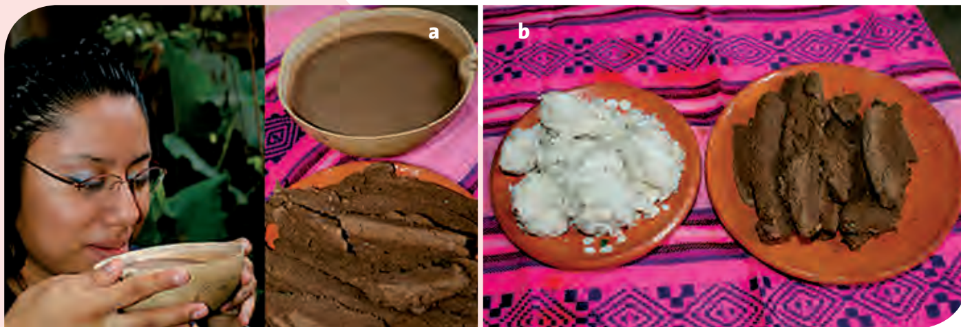
Figura 7. a: bebida de “Posol” a base de cacao, maíz, canela y vainilla: b: Posol de maíz blanco y posol de cacao, típicas del estado de Chiapas, México.

Esta bebida está hecha a base de maíz y cacao tostado ( Theobroma cacao L.), con un toque de canela ( Cinnamomum verum J. Presl). El “cacapote” se prepara como una especie de atole, mismo que se toma en caliente. En Chiapas es muy común que al término de los rezos (actividad que se realiza en honor a los santos, novenarios de los difuntos, o bien, por alguna reunión en torno a la Virgen María en cualquiera de sus advocaciones) los anfitriones brinden algo de tomar a los invitados, por lo que