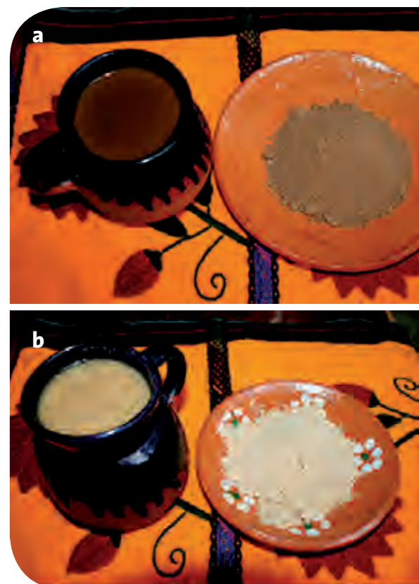
Figura 8. a: Bebida “Cacapote” a base de cacao, azúcar y canela, también conocido como “chocolate”; b: “Bebida” elaborada con maíz tostado y molido y, esporádicamente, con un toque de canela, elaborada en la región Zoque del estado de Chiapas, México.

Otra de las variantes de este dulce es el que se ofrece en la fiesta del Carnaval zoque de Ocozocoautla, Chiapas en el mes de enero y febrero, mismo que se