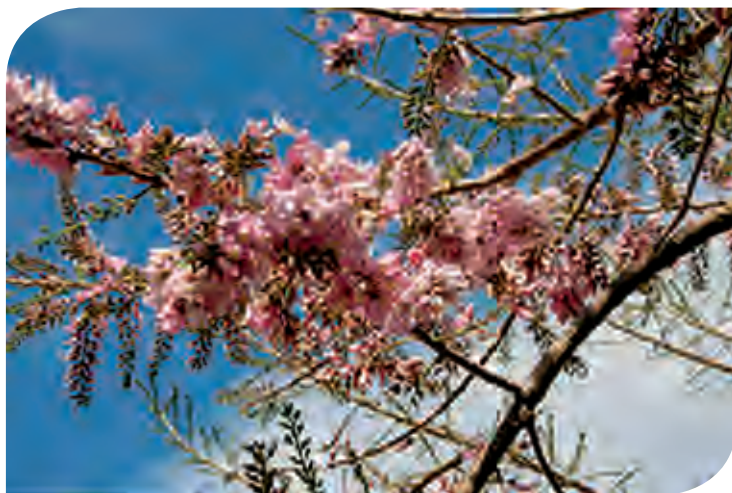
Figura 3. Flor del cocoite ( Gliricidia sepium Steud), con la que se elaboran los tamales de “cuchunuc”.

Por otro lado, el tamal de chipilín ( Crotalaria longirostrata L.) es también una delicia culinaria chiapaneca