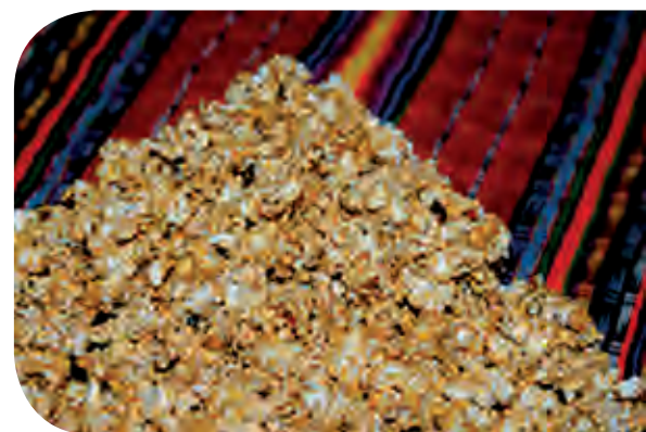
Figura 9. Dulce o palanqueta de “puc sinú” elaborado con semilla reventada de sorgo escobero ( Sorghum Technicum ), sometida al fuego y elaborado en la región Zoque del estado de Chiapas, México.