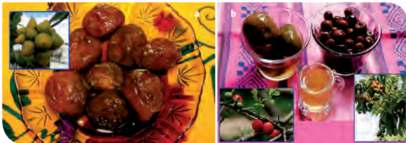
Figura 10. a: Dulce de “cupapé” o ciricote; b: Curtido de jocote y nance con la “mistela” (licor elaborado a partir del curtido), típicos de la región Zoque del estado de Chiapas, México.

Lo descrito en párrafos anteriores es una pequeña muestra de los saberes y sabores de la cultura y el pueblo zoque asentado en el centro y norte del estado de Chiapas. Este aporte, así como el rescate de la tradición oral no sustituyen de ninguna manera el verdadero saber de los zoques originales; sin embargo, el devenir intergeneracional ha implicado ciertos cambios y adición en las porciones, sustitución o enriquecimiento de algunos ingredientes, o bien, la presentación final de los alimentos, bebidas y dulces. Por ello, los autores expresan que en la captación y rescate de