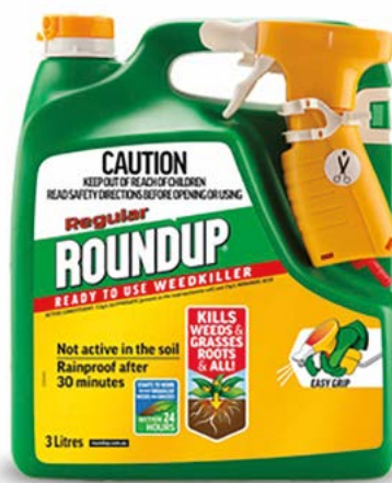
Figura 2. Una de las presentaciones comerciales de glifosato

Este herbicida también puede ser aplicado al suelo, como tratamiento presiembra en cultivos sensibles como trigo, girasol, maíz y otros. El suelo puede servir entonces como reservorio del herbicida, lo que a su vez puede afectar el metabolismo de las plantas en periodos posteriores; tal situación se relacionaría principalmente con el tipo de suelo y el contenido de materia orgánica, que retienen o liberan el herbicida, según ciertas propiedades físico-químicas. La vida media del herbicida en el suelo es de entre un mes y medio a dos meses, siendo degradado principalmente por efectos microbianos (Bortagaray-Galluzzo, 2013).