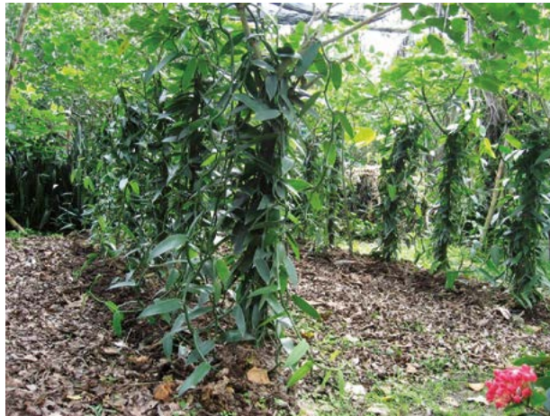
Figura 3. Cultivo de vainilla en Puntilla Aldama, San Rafael, Veracruz, México.

En contraste con el M3, en el M4 se agrupan productores con mayor conocimiento en las labores de manejo de la vainilla, como en la identificación de tutores apropiados que facilite el encauzamiento de guías, el número de flores a polinizar de acuerdo al número de macetas y vigorosidad de la planta (Figura 3). Además, tienen mayor conocimiento en el control de hongos, plagas y otros agentes causantes de enfermedades. Manejan con precisión el proceso de beneficiado y almacenamiento del fruto. Por las mismas circunstancias han conservado la orquídea al menos dos generaciones continuas.