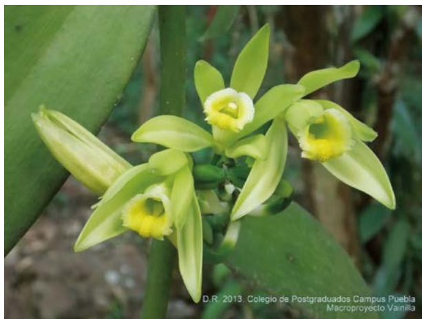
Figura 2. Flores de vainilla ( Vanilla planifolia Jacks. ex Andrews) en la región Totonacapan, México.

De esta manera se identificaron tres perfiles de rendimiento asociados con el genotipo y la ubicación geográfica del genotipo Q6. Convencionalmente, el mejor rendimiento está definido por altos valores en los órganos de cosecha (Maturano, 2002; Andrade, 1996). De acuerdo a dicho argumento el genotipo Q6 representado en los perfiles de rendimiento PR2 y PR3 de la Figura 1, podría considerarse como una referencia para seleccionar indicadores de rendimiento en