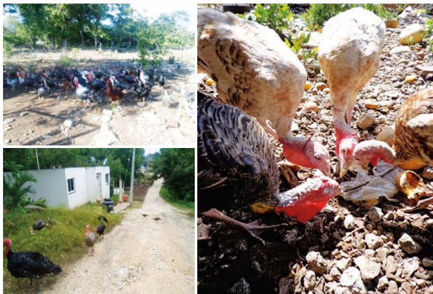
Figura 2. El pastoreo como alternativa de alimentación de guajolotes nativos ( Meleagris gallopavo ) en la región centro-sur de Campeche, México.

La alimentación del guajolote se basa en los insumos que disponen los traspacios, además de lo que el animal cosecha en pastoreo, variando su dieta con la edad. El maíz en grano ( Zea mays L.) se proporciona a guajolotes adultos (62.5%), además de masa de maíz, salvadillo y desperdicios de cocina (tortilla, pan, frutas y verduras) (31.2%). Para pavipollos en sus primeras etapas de crecimiento se utiliza alimento comercial (95.6%) el cual disminuye su mortalidad. Durante el pastoreo, los guajolotes consumen hierbas, pastos, gusanos e insectos que recogen directamente del suelo (Figura 2); con esta práctica se favorece la aportación de proteína a la dieta de los animales (Tovar-Paredes et al. , 2015), además de que no genera problemas de enfermedades debido a la resistencia y adaptación de estas aves a condiciones lo-