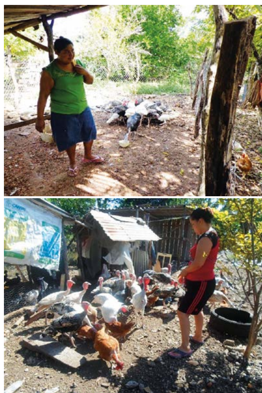
Figura 1. Participación de la mujer en la crianza y manejo del guajolote nativo ( Meleagris gallopavo ) en el centro-sur de Campeche, México.

La comercialización del guajolote se realiza en la misma comunidad (40.8%) y el resto lo venden a restaurantes de la Ciudad de Campeche (40.4%) que lo ofrecen como un platillo preferente (relleno negro o mole de guajolote). El animal sacrificado sirve de complemento a la dieta de la familia, constituidas de 4 a 6 integrantes (56.2%), situación similar a lo informado por Canul et al. (2011) en Yucatán, México. Es común el intercambio de pie de cría en forma remunerada entre familias y vecinos, lo que sugiere aumento de la endocría, con efectos desfavorables en la reproducción.