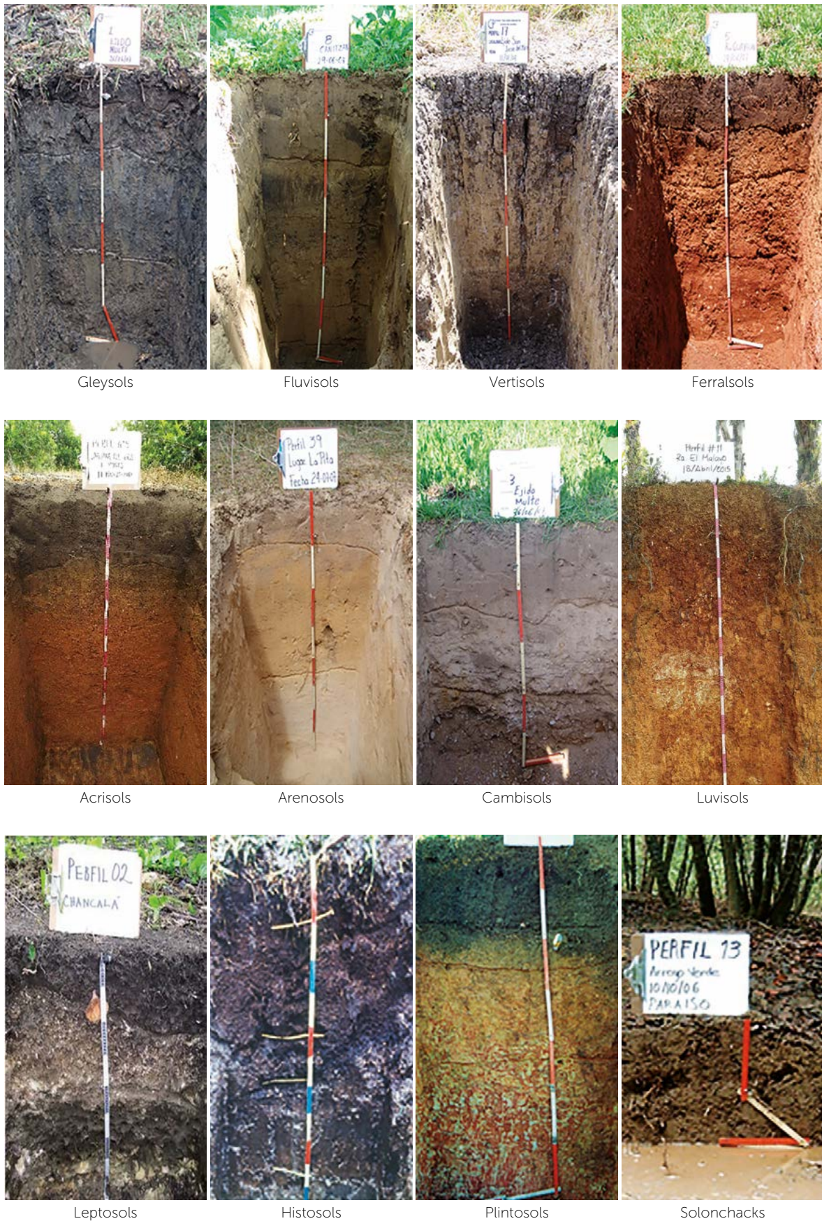
Figura 2. Perfiles de los Grupos de suelos más representativos en Tabasco, México.