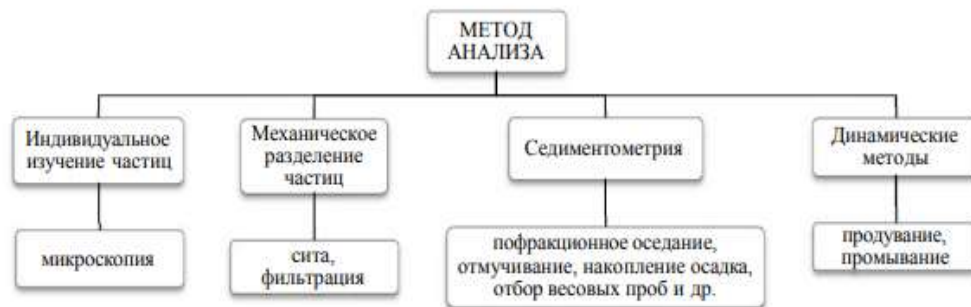
Рис. Классификация методов гранулометрического анализа, предложенная Г.И. Ромашовым.

В наши дни существует множество классификаций методов дисперсионного анализа. Ниже приведена классификация Г.И. Ромашова (рисунок), опубликованная в 1938 году [3]. Все методы анализа сгруппированы в соответствии с физическими принципами, на которых они основаны.