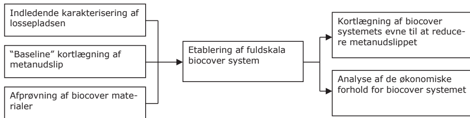
Figur 1. Aktiviteter i protokol for dokumentation af biocoverprojekt.