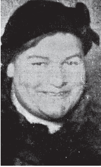
Figura 1. La curandera “Mamita rubia”