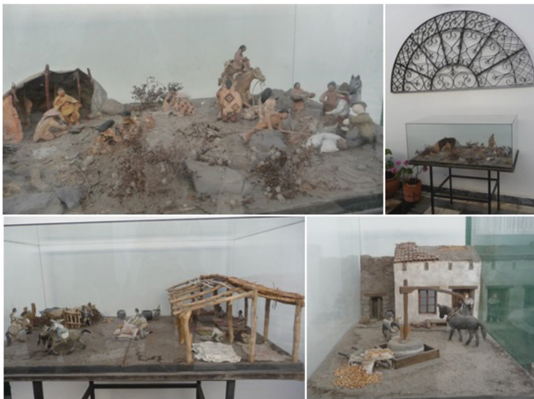
Figura 5: Arriba, maqueta que representa la vida en un toldo indígena y ubicación del modelo sin texto explicativo. Abajo, maquetas restantes referidas al funcionamiento del saladero y de una tahona

e intercambios con algunos individuos vestidos como criollos y de tono de piel más claro, lo que da cuenta de los mestizajes presentes en estos enclaves fronterizos.