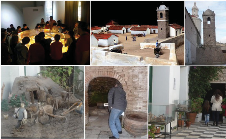
Figura 4: Museo “Nozzi”. Arriba, maqueta del Fuerte del Carmen y la torre de la capilla del fuerte en la actualidad. Abajo: “Cueva maragata” en el patio del museo, su interior con referencia de escala humana y detalle de la maqueta en la que se la representa

Asimismo, se incluyó la torre que originariamente fue campanario de la capilla del fuerte y atalaya para vigilar los alrededores, construida en 1780 con bloques irregulares de piedra arenisca compactada y consolidada, conocida localmente como “tosca mora”. Cuando en 1880 se decidió la demolición del fuerte, se preservó la torre como testimonio del mismo y aún continúa en pie, protegida tempranamente a escala nacional al declararla “monumento histórico nacional” en 1942 (Decreto n. 120.411).