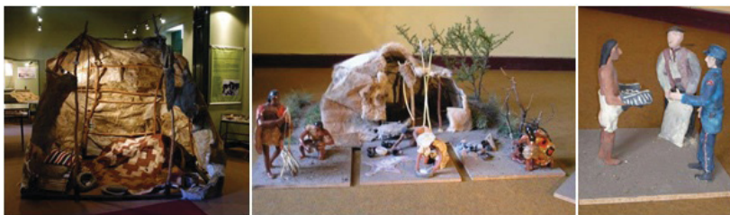
Figura 3: Réplica de un toldo indígena y maqueta de la vida cotidiana en las tolderías con detalle de representación anexa