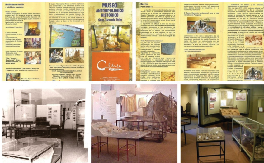
Figura 2: Museo “Tello”. Folleto de difusión “Nuestra Muestra Permanente” y fotografías de las salas referidas a grupos indígenas, de izquierda a derecha: etapa fundacional (década de 1970) y vista de la maqueta del Fuerte (2003 y 2006, respectivamente)