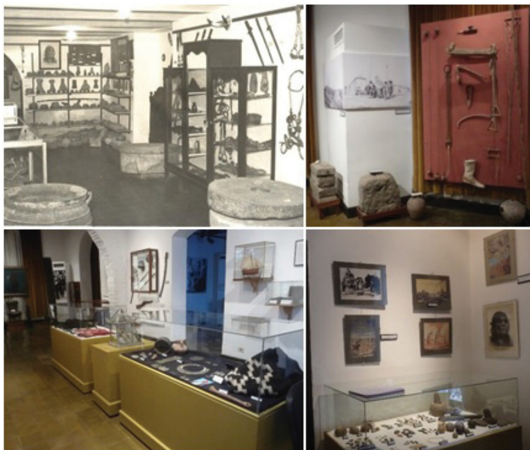
Figura 6: Sala referida a los tehuelches en el museo municipal (década de 1970) y referencias a los primeros pobladores españoles y a grupos indígenas en las salas actuales (2013)

En el interior de las salas descubrimos algunos elementos y detalles que posibilitan a los visitantes establecer lazos con las escenas representadas, tales como herramientas – por ejemplo, los morteros en manos de los indígenas –, vestimenta u otros artefactos como las ollas que aparecen utilizadas por los españoles. Asimismo, se ha colocado una olla en el interior de la “cueva maragata” del patio para recrear el ambiente y el tipo de actividades que tuvieron lugar en ella. Tal como se puede observar en la Figura 6, algunas de estas ollas formaron parte de las primeras exposiciones en las salas del museo, cuando éste aún dependía de la municipalidad en la década de 1970.