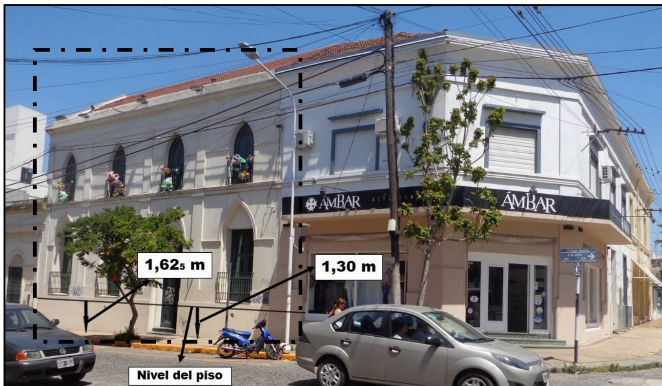
Figura 3. Foto de la actual casa de Juan Fugl, donde se puede observar en el recuadro punteado la estructura original de la casa, con la línea negra marcando el piso de madera de pino tea y cómo este se distancia de la vereda que respeta la pendiente natural del terreno. Esta pendiente desagua en el arroyo del Fuerte (actualmente entubado).

les n.º 1. El frente de todo el edificio está dividido en paneles separados por pilares rectangulares y, en los inicios de la ochava, por pilares en ángulo. Sobre la calle 9 de Julio hay 5 paneles, 1 en la ochava y 6 sobre Maipú. En cada panel hay ventanas y en uno de ellos, sobre la calle 9 de Julio, una puerta lateral (la actual entrada a la Escuela de Artes Visuales), y en la ochava se encuentra la puerta principal. Todos aparecían originariamente con arcos en ojiva, que en gran parte se encuentran modificados (fig. 3, Ortiz 2006).