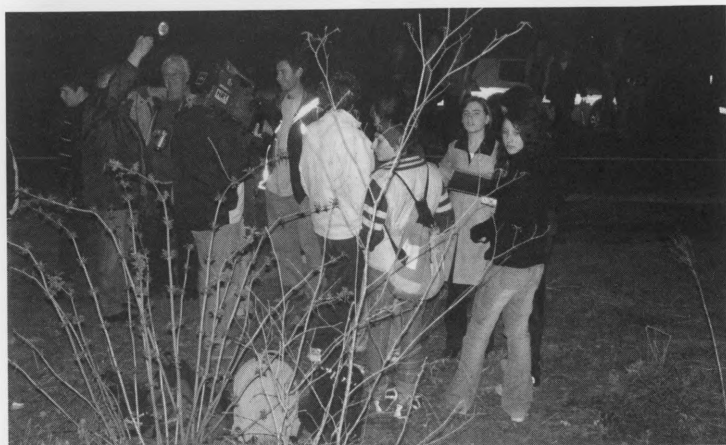
Dani žaba, 20. travanj 2004.