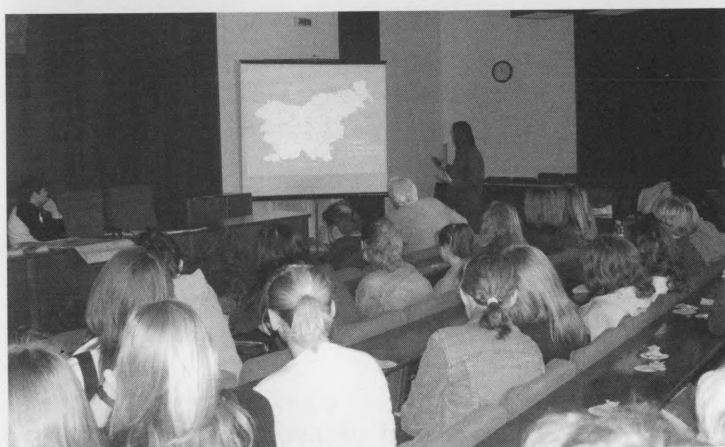
Seminar o stradavanju vodozemaca, 21. travanj 2004.