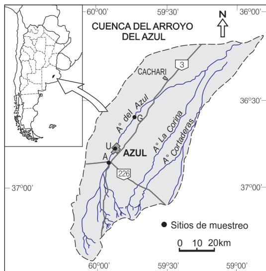
Fig. 1. Localización geográfica de los sitios de muestreo en el arroyo del Azul.

Azul y comparar estos resultados entre tramos en los que existen diferentes usos del suelo.