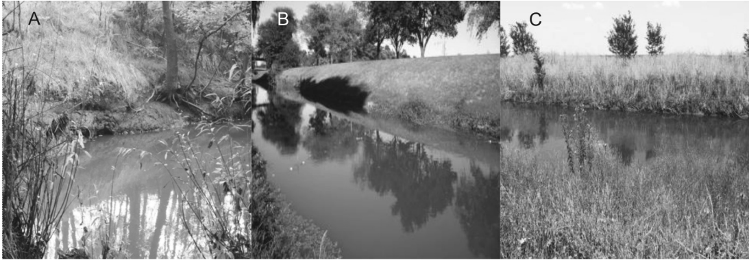
Fig. 2. Sitios de muestreo del arroyo del Azul. A: tramo agrícola, B: tramo urbano, y C: tramo ganadero.

durante 4 horas en sitios cercanos a la trampa. Los ejemplares fueron identificados a nivel específico según Ringuelet et al. (1967), López et al. (1987), Casciotta et al. (2005), Rosso (2006) y Miquelarena et al. (2008). Se determinó la abundancia y la biomasa específica (0,1 g).