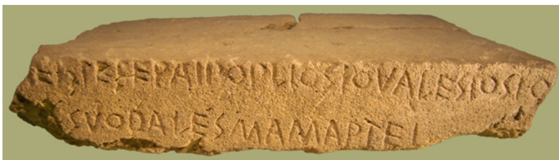
Figura 1. Il lapis satricanus .

Bibliografia selezionata: De Simone, 1978, 95-98; Peruzzi, 1978; Pallottino, 1978, 98-99; Mancini, 1979, 370-375; Prodocimi, 1979, 173-221; Pisani, 1980, 23; Stibbe, 1980; Guarducci, 1980, 479-490; De Simone, 1981, 25-56; de Waele, 1981; Mancini, 1981, 365-369; Versnel, 1982, 193-235; Durante, 1982, 65-68; Prodocimi, 1984; Campanile, 1985; Untermann, 1986; Lejeune, 1989, 60-63, 68-69; Silvestri, 1993; Prodocimi, 1994; Coarelli, 1995; Colonna, 1996; de Waele, 1996; Versnel, 1997; Lucchesi e Magni, 2002; Rocca, 2009; Bakkum, 2009, 132-135.