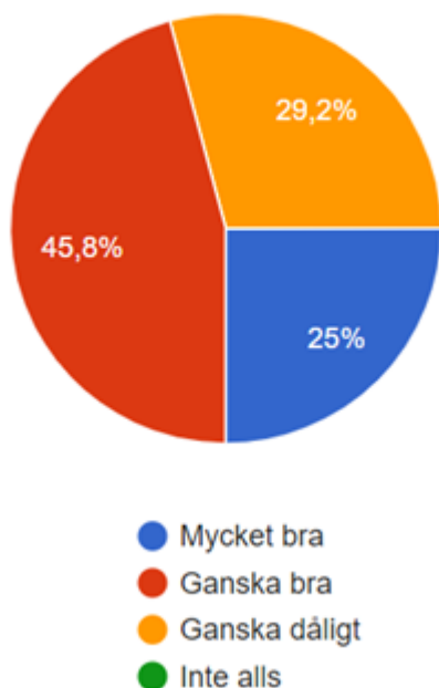
Figur 2. Testpersonernas upplevelse av vältvarningsfunktionen