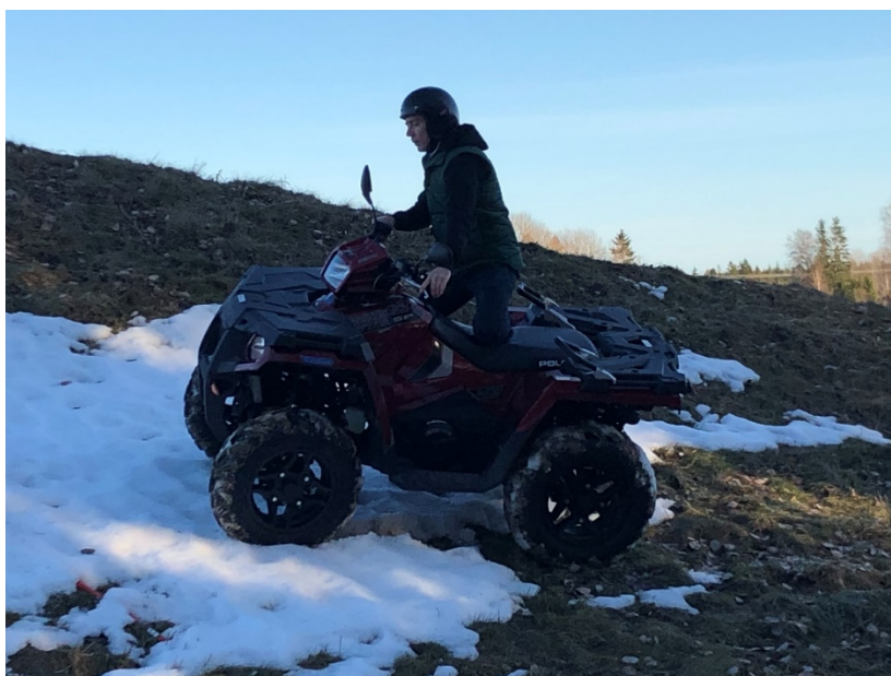
Figur 1. Vältvarningssystemet testades i olika miljöer och under olika årstider.

”När det gäller aktiva säkerhetsutrustningar har Snö- och terrängfordonsbranschen kommit fram till att den bästa lösningen nu och på sikt är en vältvarnare som känner av terrängskoterns lutningsvinklar och varnar föraren då man närmar sig dessa situationer”