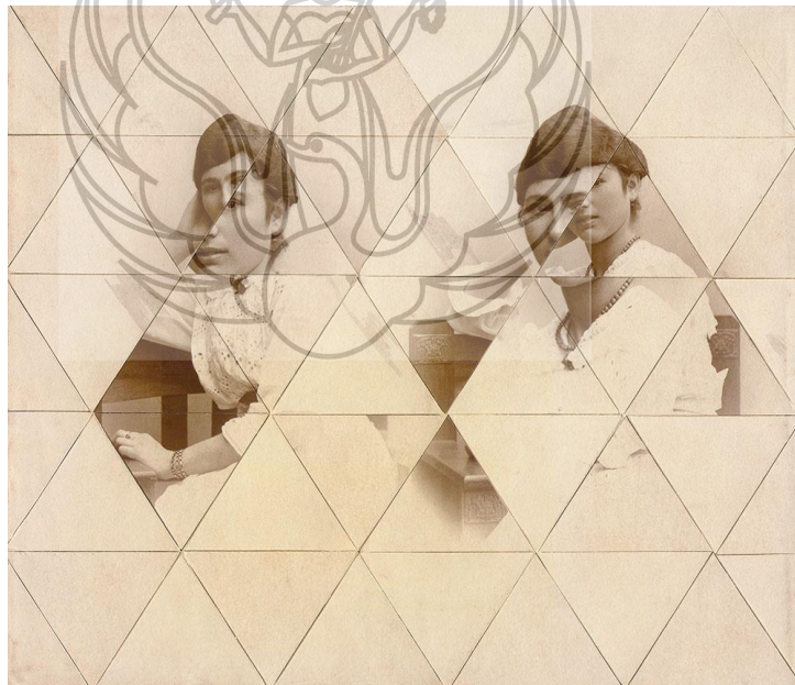
Gambar 1. Foto transformasi elemen geometri karya Susana Blasco

Sedangkan secara ide yang direpresentasikan, tentu saja telah ada yang membuat sebuah karya dengan mentransformasi foto, karya tersebut antara lain dari Susana Blasco, seorang desainer grafis, ilustrator, dan kolagis, berasal dari Bilbao, Spain. Beberapa karyanya telah mentransformasikan foto kedalam elemen-elemen geometris. Berikut adalah salah satu fotonya yang di transformasikan kedalam elemen geometris persegi dalam bentuk kolase.