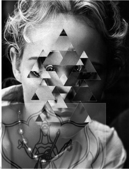
Gambar 2. Foto transformasi elemen geometri karya Gordon Magnin Sumber : http://kolajmagazine.com/artistdirectory/gordon-magnin

menatap balik terhadap orang yang melihat karyanya. Berikut adalah salah satu karya Magnin.