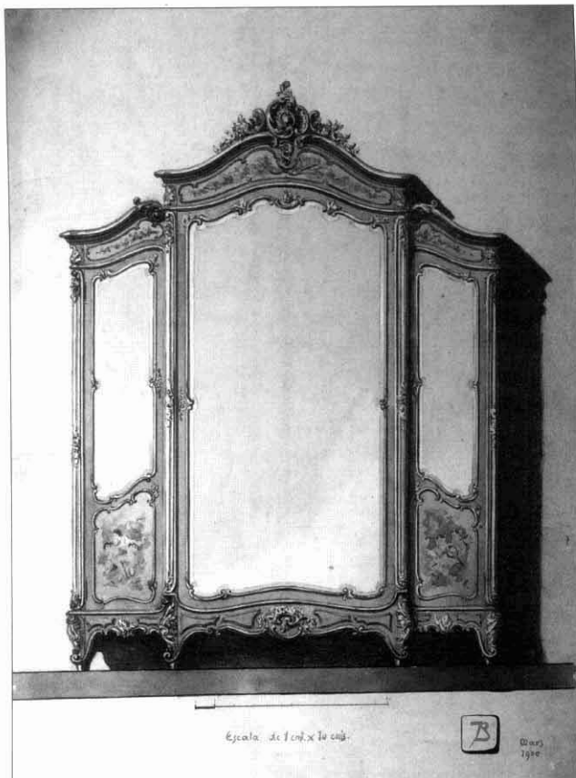
FOTOGRAFIA 1. Projecte aquarellat d'armari estil Lluís XV «modernitzat». Març 1900. Signat J.B. [Joan Busquets i Jané].

d'aquest eclecticisme imperant a l'inici de segle, malgrat que l'anomenat estil Art Nouveau triomfava arreu d'Europa i també aquí a Catalunya, és el