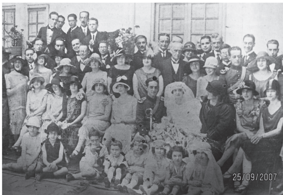
Figura 3. Fotografía de la celebración de un matrimonio en la que se puede apreciar, el vestuario de la época. En estas ceremonias se hace pública la consolidación en el ámbito privado de la unión familiar.

Cuando llegaba la tan esperada fecha, los matrimonios se celebraban casi al final de la mañana, y la fiesta se realizaba en los grandes salones de las casas de ese entonces, o en los clubes sociales. No eran pocos los chismosos que acudían al púlpito, además de los invitados que, según su prestandia y cercanía con la familia, ocupaban los primeros puestos en la iglesia. La novia entraba de blanco y tras este impoluto color, connotaba su virginidad, garantizando con ello que ese hijo primero fuera sólo de la familia que la entregaba en el ritual matrimonial. El novio, como aún lo dictaba el ritual católico, debía llegar primero y esperar en la iglesia, mientras el padre se libraba de la responsabilidad de su hija, delegando ese deber a quien sería su esposo.