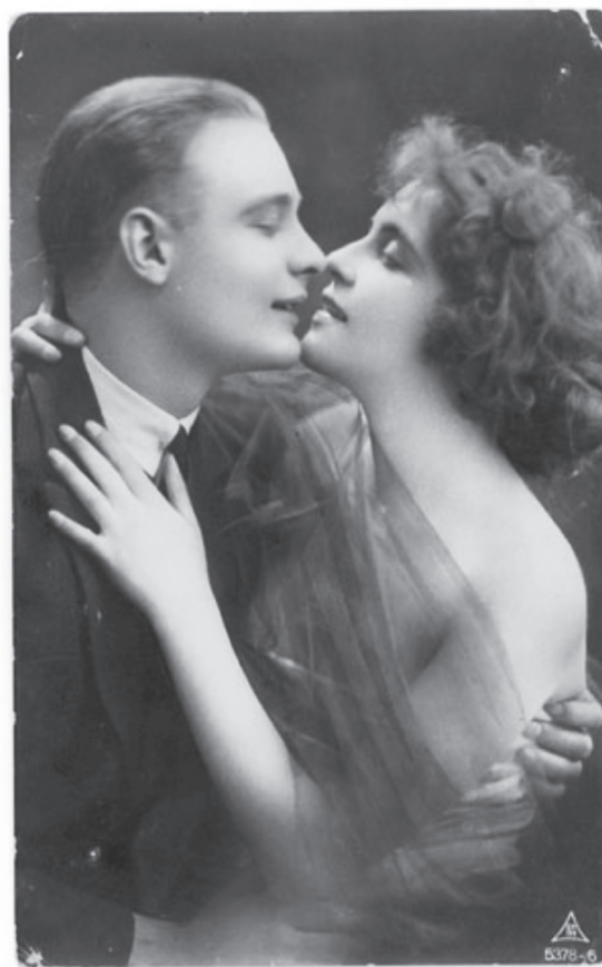
Figura 2. Esta postal romántica de 1926 que aparece titulada como La Fiesta, es una muestra de la iconografía que circulaba alrededor del amor idealizado, propio de las películas y novelas de ese entonces. (Álbum Familiar de Bogotá, 2013).

valía suspirar por el hombre o la mujer amada, si la obligación de casarse con quien se consideraba más conveniente, según la familia, seguía siendo un remanente de la mentalidad feudal, aún alejada de esa idea moderna de la que habla Marshall Berman en que las elecciones hacen parte de las nuevas experiencias que se le abren al individuo del siglo XX: “ser modernos es encontrarnos en un entorno que nos promete aventuras, poder alegría, crecimiento, transformación de nosotros y del mundo, y que, al mismo tiempo, amenaza con destruir todo lo que tenemos” (1991, p. 1).