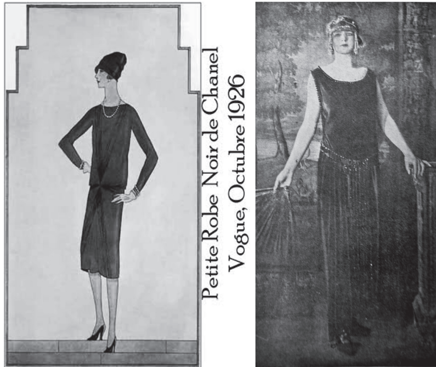
Figura 5. Ejemplos de los icónicos vestidos negros que circularon durante la época. Cromos 1922, febrero 11.

Mientras en ciertas épocas y contextos el negro connota respeto y tristeza, cabe anotar que para muchos, desde los años veinte, hasta hoy, es sinónimo de elegancia y sobriedad. Más aún tras el icónico vestido negro de Coco Chanel, quien en la Revista Vogue de Octubre de 1926, instauro este estilo sobrio y muy acorde con la guerra, pero que más adelante será el tan anhelado grado cero, que le permite a las mujeres estar bien presentadas en cualquier contexto.