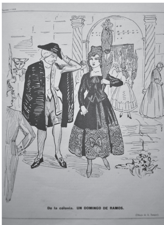
Figura 1. Un nostálgico artículo da cuenta de la mantilla bogotana como un remanente de lo señorial en la mentalidad de los bogotanos de esta época. (Cromos 1922, abril 1, No. 300).

el corsé, hizo parte de los discursos alrededor del cuerpo, la higiene, el habla culta y la urbanidad. Se asociaron de manera contundente con un vestuario que reforzó mitos alrededor de las aspiraciones y abolengos de aquellos ciudadanos (y aún no ciudadanas) que buscaban “el progreso”, antes que la vulgarización y la democratización de ciertos modos civiles amenazaran el repertorio sobre el que construyeron gran parte de su identidad los cachacos y las damas santafereñas. Los dos tan bien vestidos, poetas y políglotas, en sus fiestas y tertulias quedaron plasmadas muchas de las narrativas 6 alrededor de alcanzar esa idea de ser modernos, atravesada por los matices y traducciones con que se acomoda este concepto a las conveniencias y preferencias de dicha élite ilustrada y su afán por demostrar que eran los portadores de una cultura más aventajada. Al respecto dice Madam Valmore: “en esta época en que tantas ideas nuevas fructifican en el campo de las reformas sociales, en que tantas semillas renovadoras nos preocupan, las modas adquieren día a día mayor importancia estética y social” (Cromos 1922, febrero 11, p. 293).