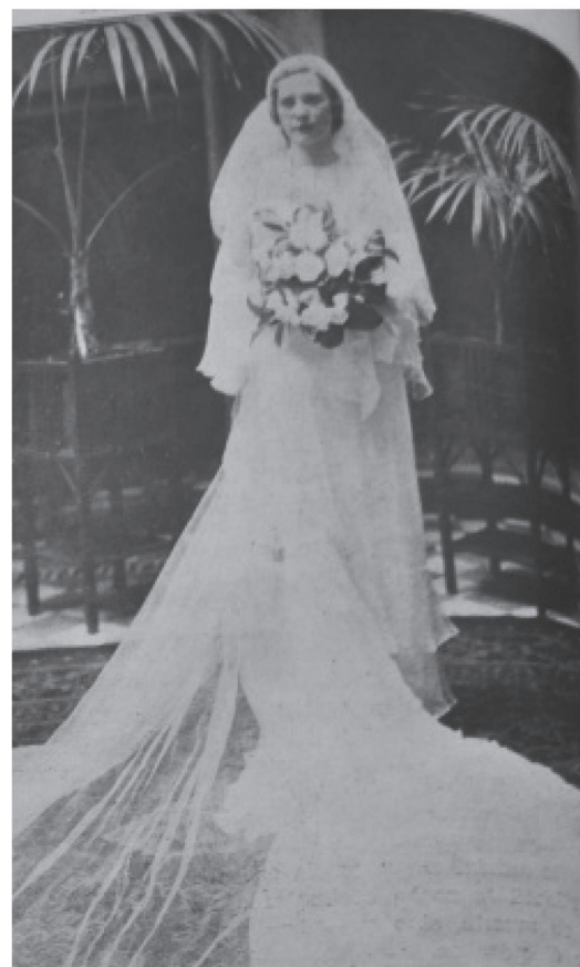
Figura 4. Fotografía en que se puede apreciar el vestido de novia que se popularizó durante la década del treinta. En este período se hace notorio que el vestido retoma el largo que se usó en el XIX, sin el ancho del traje polisón. Transformaciones formales que no compiten con la simbología mariana del traje de novia (Revista Cromos 1935, enero 19).

La mancha sagrada que en ciertos grupos de católicos era expuesta al público, aunque quedara sólo en el lecho nupcial, seguía siendo un símbolo de que el ritual se completaba de manera satisfactoria. Era mucha la fe que se le tenía a este feliz comienzo: cada cosa que pudiera fallar era un augurio terrible.