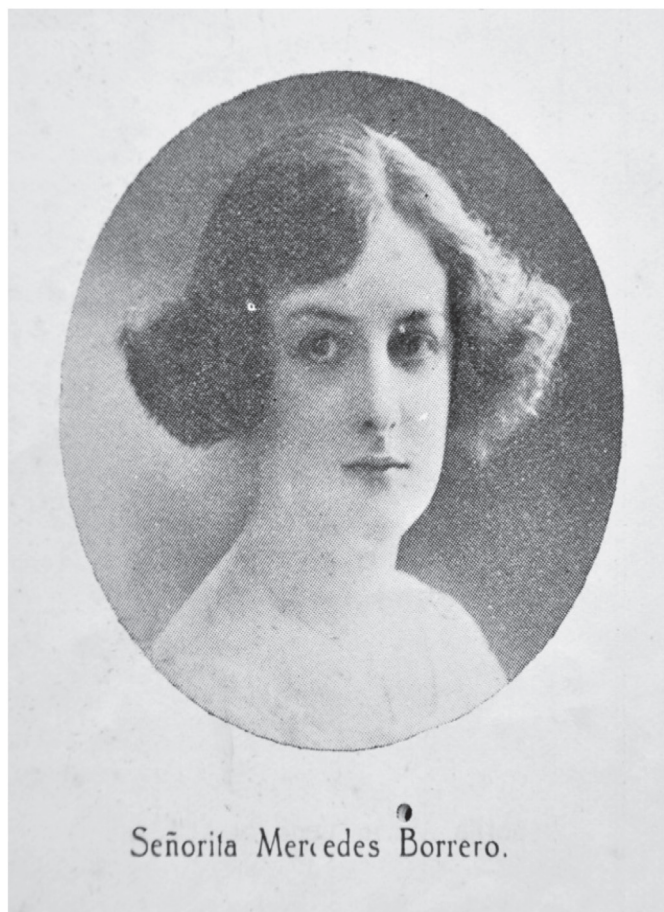
Figura 7. Fotografía que ilustra la manera en que las casamenteras de ese entonces publicitaban su imagen en la revistas. (Cromos, 1923, 383).

Por otro lado, la prensa escrita, que desde el siglo XVIII fue una herramienta para expresar públicamente el pensamiento individual, permeó, mediante esos “cuerpos de papel” (Traversa, 1997) los idearios de muchas personas. En las páginas sociales de la Revista Cromos, El Gráfico Ilustrado, el periódico El Tiempo, entre otros, se encontraban a lo largo del día los matrimonios de los individuos más influyentes de la sociedad. Esto, sin que también se exhibieran fotografías y poemas de las casamenteras, a la vez que cuando un rico graduado volvía de hacer estudios en el exterior, su fotografía y su resumen profesional, lo hacían candidato para uniones convenientes entre las élites capitalinas.