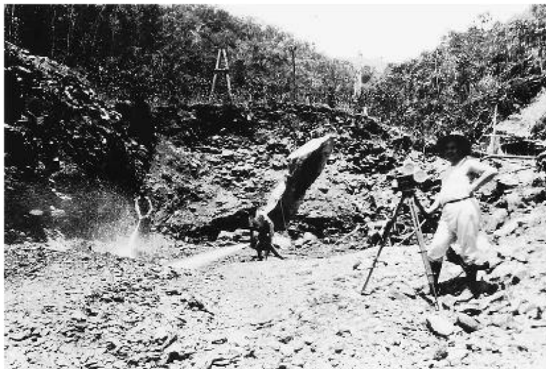
Figura 7. Filmación de El Dique de Petaquire , Anzola con la cámara a la derecha.