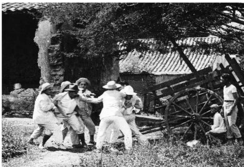
Figura 4. Foto fija de La Trepadora durante el rodaje de la película.