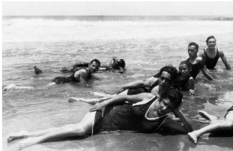
Figura 5. Foto fija de “Amor, tú eres la vida” durante el rodaje en Macuto.

La Figura 5 muestra el rostro de los ganadores del casting; incluso muestra que la filmación de Amor, tú eres la vida se realizó en Macuto por la cercanía a Caracas y Chacao. Al menos una parte del filme se desarrollaría en el mar, privilegiando el paisaje del litoral (en contemplación rural) contrastado con la ciudad (hierática urbe) donde se desarrollaba la historia de amor.