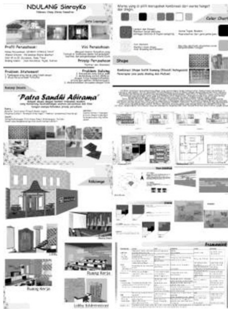
Gambar 4.4 Berkas desain Iriene (P4)

EQUILIBRIUM , V/09 p : 1-8, Universitas Brawijaya, Malang.