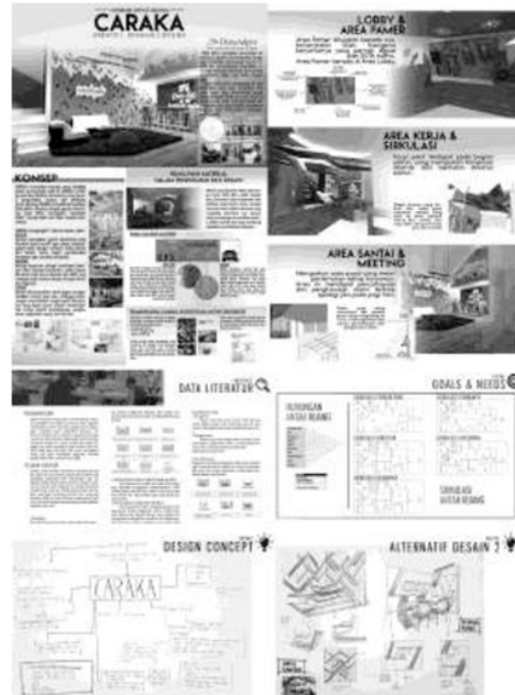
Gambar 4.3 Berkas desain Lauren (P3)