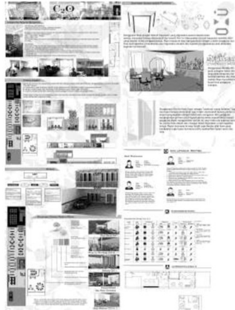
Gambar 4.2 Berkas desain Yoshudara (P2)